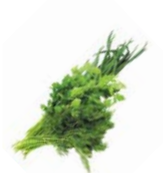
ЗЕЛЕНЬ АССОРТИ, 1уп. (100 г)