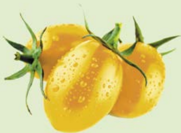
ТОМАТ СЛИВКА желтая 1 уп. (350 г)