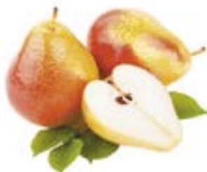
ГРУША ФОРЕЛЬ, 1кг