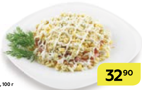
Салат ЦАРСКИЙ, 100 г