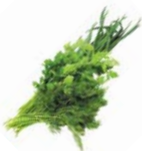
ЗЕЛЕНЬ АССОРТИ, 1уп. (100 г)