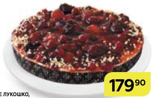
Торт песочный ФЛАН ЯГОДНОЕ ЛУКОШКО, 620 г