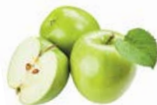
ЯБЛОКИ ГРЕННИ СМИТ, 1кг