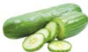
ОГУРЦЫ, ГЛАДКИЕ, 1кг