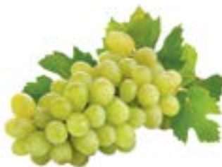
ВИНОГРАД БЕЛЫЙ, 1кг