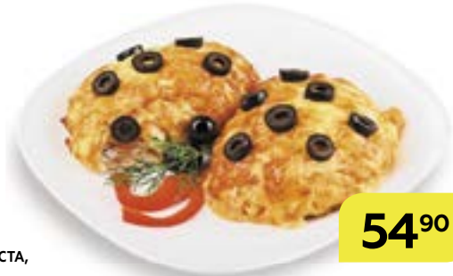
Свинина ФИЕСТА, 100 г