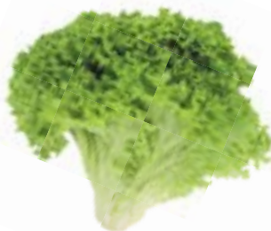
САЛАТ ЛИСТОВОЙ, 1уп. (100 г)