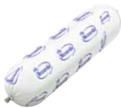
СЫР МОЦАРЕЛЛА ALTI ~2 кг арт. 625562