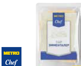
СЫР ЭММЕНТАЛЕР METRO CHEF НАРЕЗКА 500 г арт. 621702

ОТ ШТ. 1 ОТ 311 00 1 ШТ. ОТ ШТ. 3 ОТ 279 90 1 ШТ. ОТ ШТ. 6 ОТ 248 80 1 ШТ.