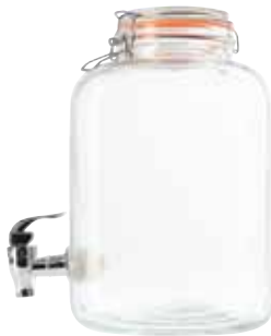
ДИСПЕНСЕР ДЛЯ НАПИТКОВ 4,15 л арт. 610146