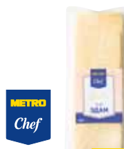
СЫР ЭДАМ METRO CHEF НАРЕЗКА 500 г-1 кг арт. 621675, 621703

ОТ ШТ. 1 565 00 1 ШТ. ОТ ШТ. 3 508 50 1 ШТ.