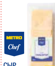
СЫР ТИЛЬЗИТЕР METRO CHEF НАРЕЗКА 500 г - 1 кг арт. 621672, 621667

ОТ ШТ. 1 409 00 1 ШТ. ОТ ШТ. 3 368 10 1 ШТ. ОТ ШТ. 6 347 65 1 ШТ.