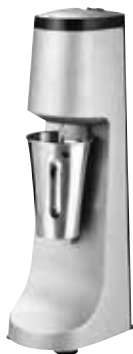
МИКСЕР ДЛЯ КОКТЕЙЛЕЙ GASTRORAG W-DM-A

Габаритные размеры: 208x158x500 мм Мощность: 0,40 кВт Миксер для коктейлей, 1 шпиндель, 2 скорости, 1 стакан из нерж.стали емкостью 0,95 л, материал корпуса - пластик. арт. 493070