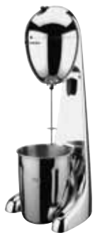
МИКСЕР ДЛЯ КОКТЕЙЛЕЙ GEMLUX GL-MS-01

Объем стакана 0,5 л Материал стакана нерж.сталь Мощность 0,10 кВт Габаритные размеры 158x156x386 мм Количество мешалок 1 Количество стаканов 1 арт. 631485