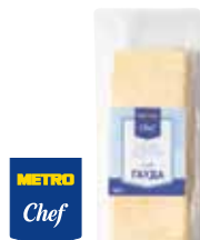
СЫР ГАУДА METRO CHEF НАРЕЗКА 500 г – 1 кг арт. 621670, 621705

ОТ ШТ. 1 ОТ 301 00 1 ШТ. ОТ ШТ. 3 ОТ 270 90 1 ШТ. ОТ ШТ. 6 ОТ 255 85 1 ШТ.