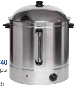
КУКУРУЗОВАРКА GASTRORAG ДКЕС40

Габаритные размеры 400x470x510 мм Мощность 2,50 кВт Аппарат для кукурузы электрический, настольный, с терморегулятором (30-110°C) и функцией подогрева, с перфорированной вставкой, емкость 40 л, вместимость 8 кг зерна/40 початков, материал корпуса - нерж.сталь.