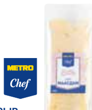
СЫР МААСДАМ METRO CHEF НАРЕЗКА 500 г-1 кг арт. 621671, 621666

ОТ ШТ. 1 ОТ 301 00 1 ШТ. ОТ ШТ. 3 ОТ 270 90 1 ШТ. ОТ ШТ. 6 ОТ 255 85 1 ШТ.