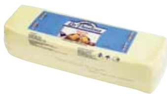
СЫР МОЦАРЕЛЛА LA PAULINA ~3,3 кг арт. 530731