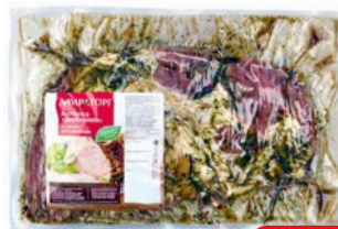
Лопатка для запекания ДОМАШНЯЯ , Охлажденная (Мираторг), 1 кг