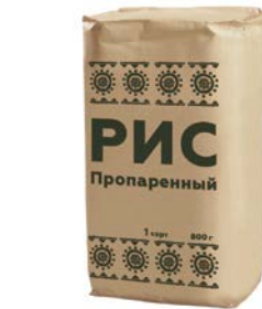
РИС Пропаренный, 1-й сорт, 800 г