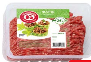
Фарш ГОВЯЖИЙ , охлажденный (ЧМПЗ), 400 г