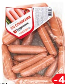
Сосиски СО СЛИВКАМИ, Классические, Генеральские колбасы (Агротэк), 100 г