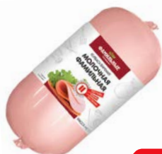
Колбаса МОЛОЧНАЯ, вареная, мини (Фамильные Колбасы), 400 г

* Цена за единицу товара при единовременной покупке 2 одинаковых акционных товаров