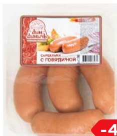
Сардельки ДЫМ ДЫМЫЧЬ, С говядиной, мини (Агротэк), 100 г

* Цена за единицу товара при единовременной покупке 2 одинаковых акционных товаров