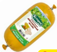
Колбаса ДОКТОРСКАЯ, Прайм, Хуторок (Фамильные колбасы), 450 г