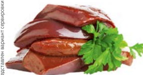
ПЕЧЕНЬ ГОВЯЖЬЯ** , полуфабрикат из замороженного сырья, 1 кг

Представлен вариант сервировки продукции