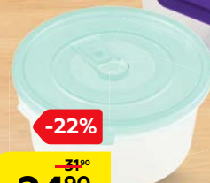
Емкость СМАЙЛ, круглая, с клапаном, 0,8 л