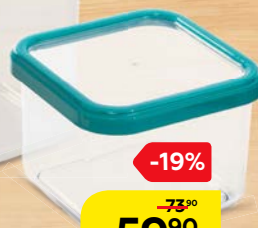
Контейнер ПРЕМИУМ, квадратный, 0,6 л