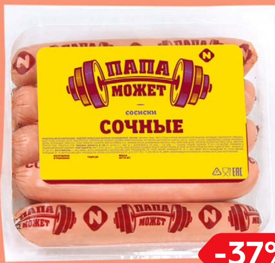
Сосиски ПАПА МОЖЕТ, Сочные, 450 г