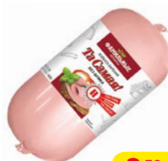
Колбаса ТА САМАЯ, Вареная, без шпика (Фамильные колбасы), 400 г