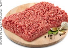
ФАРШ СВИНОЙ** , охлажденный, 1 кг

Представлен вариант сервировки продукции