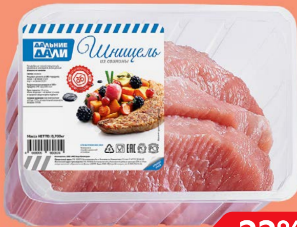
Шницель ДАЛЬНИЕ ДАЛИ , из свинины (Агро-белогорье), 700 г