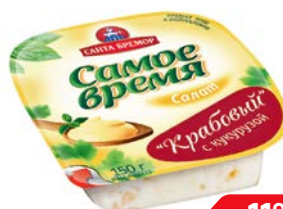
Салат САТА БРЕМОР , Крабо- вый, 150 г