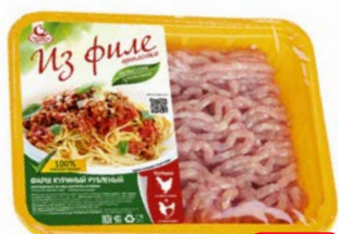
Фарш ПАВЛОВСКАЯ КУРОЧКА , куриный рубленый, охлажденный, 500 г