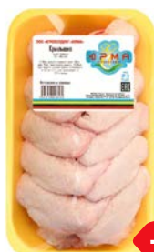
Крыло цыпленка- бройлера ЮРМА охлажденное (Агрохолдинг Юрма), 1 кг