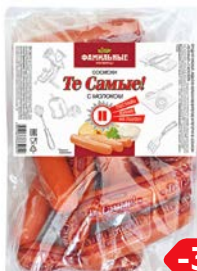
Сосиски ТЕ САМЫЕ, С молоком, мини (Фамильные колбасы), 100 г