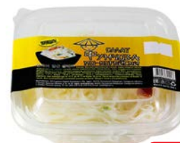
Салат ФУНЧОЗА , по-корейски (ИП Сорокин), 200 г