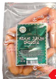
Сосиски ТЭМЛЕ ХАЛЯЛЬ (Сызранский МК), 500 г