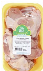
Набор для чахох- били и шашлыка ПРИОСКОЛЬЕ , охлажденный, 1 кг