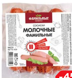
Сосиски МОЛОЧНЫЕ, мини (Фамильные колбасы), 400 г