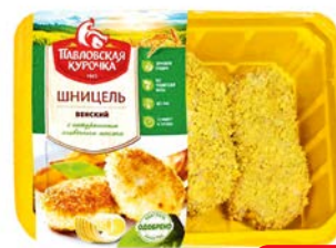
Шницель, ВЕНСКИЙ , в пани- ровке, охлажден- ный (Павловская Куручка), 440 г