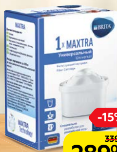
Сменный модуль БРИТА, Макстра