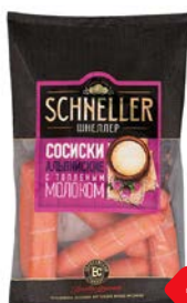
Сосиски ШНЕЛЛЕР альпийские с топленым молоком, 450 г