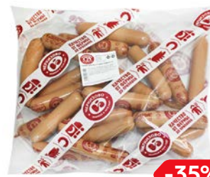
Сосиски ЧЕРКИЗОВО, сливочные, 650 г