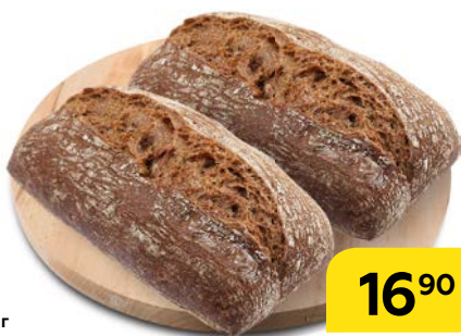
Булка РИЖСКАЯ, 53 г