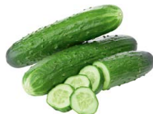
ОГУРЦЫ, ПУПЫРЧАТЫЕ, 1кг