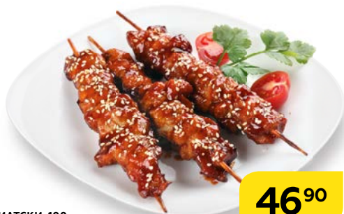
Курица ПО-АЗИАТСКИ, 100 г