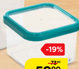
Контейнер ПРЕМИУМ, квадратный, 0,6 л