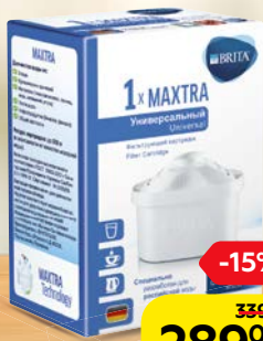
Сменный модуль БРИТА, Макстра