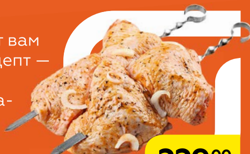
Полуфабрикат ШАШЛЫК КУРИНЫЙ, в маринаде, охлажденная, 1 кг

Нежное мясо в сочетании с пикантным маринадом покорит сердца всех ваших гостей.