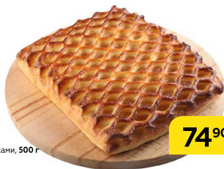
ПИРОГ с яблоками, 500 г