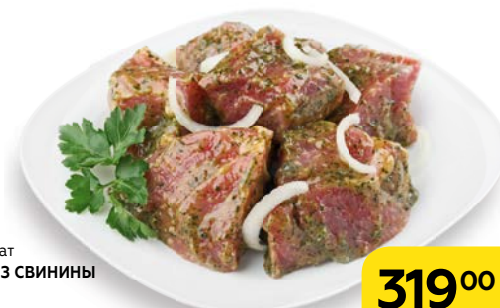
Полуфабрикат ШАШЛЫК ИЗ СВИНИНЫ в маринаде «Французский сад», 1 кг