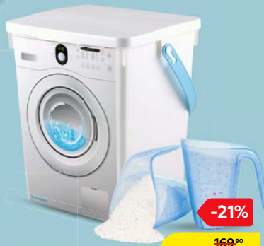
КОНТЕЙНЕР ДЛЯ ПОРОШКА, 5 л