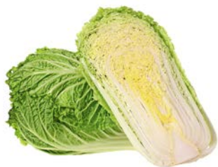
КАПУСТА ПЕКИН- СКАЯ, 1кг