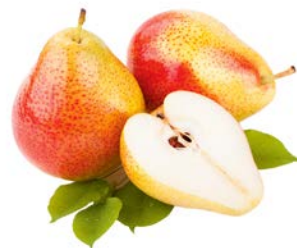
ГРУША ФОРЕЛЬ, 1кг