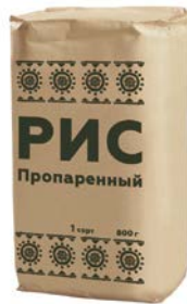
РИС Пропаренный, 1-й сорт, 800 г