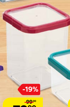
Контейнер ПРЕМИУМ, квадратный, 1,2 л