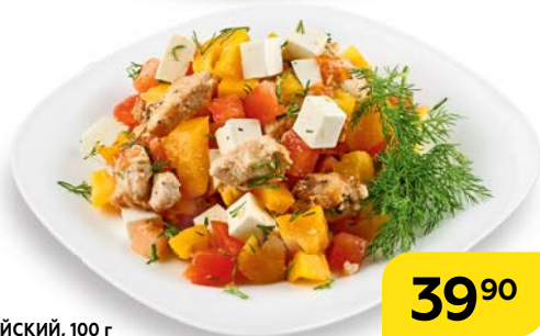
Салат БЕЛЬГИЙСКИЙ, 100 г