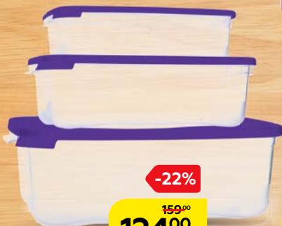
Набор контейнеров КАСКАД, 0,7л+1,2л+2,2л, для СВЧ-печи, 3 шт.