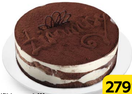
Торт ТИРАМИСУ, бисквитный, 650 г