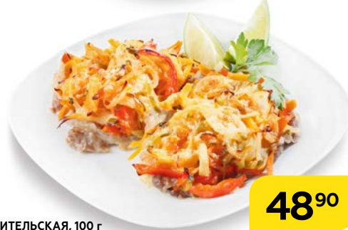
Свинина ЛЮБИТЕЛЬСКАЯ, 100 г