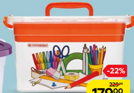
КОНТЕЙНЕР ДЛЯ ХРАНЕНИЯ с вкладышем, 6,5 л, в ассортименте***