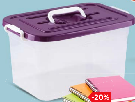
КОНТЕЙНЕР ДЛЯ ХРАНЕНИЯ, 10 л