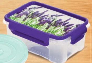
Контейнер ЛОК ДЕКОР для СВЧ-печи, 0,75 л