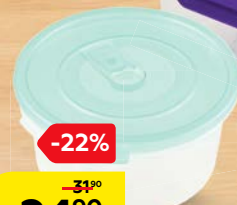
Емкость СМАЙЛ, круглая, с клапаном, 0,8 л