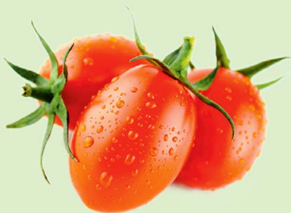
ТОМАТЫ СЛИВКИ, 1кг