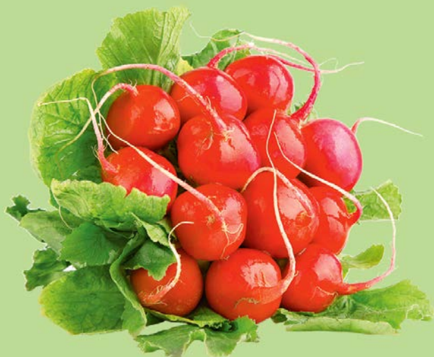
РЕДИС, 1уп. (500 г)