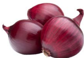
ЛУК РЕПЧАТЫЙ красный, 1кг