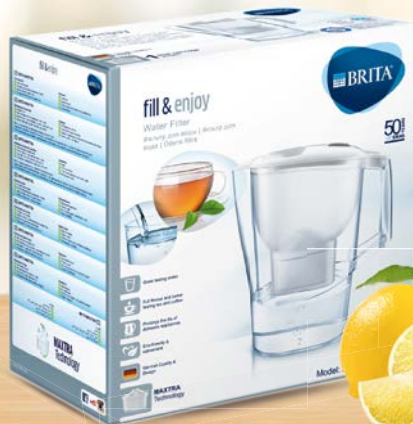
Фильтр-кувшин БРИТА, Алуна, XL, 3,5 л