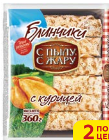
Блинчики С ПЫЛУ С ЖАРУ, С курицей, 360 г