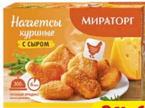
Наггетсы куриные МИРАТОРГ, С сыром, 300 г