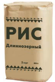
РИС длиннозерный, 800 г