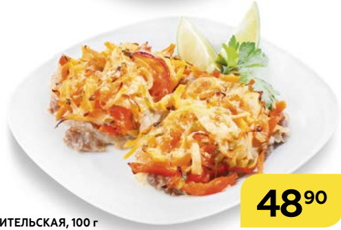
Свинина ЛЮБИТЕЛЬСКАЯ, 100 г