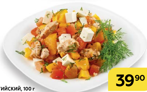
Салат БЕЛЬГИЙСКИЙ, 100 г