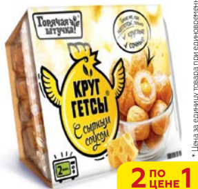
Круггетсы ГОРЯЧАЯ ШТУЧКА, С соусом, 250 г