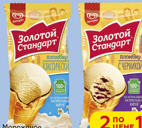
Мороженое ЗОЛОТОЙ СТАНДАРТ, Пломбир в вафельном стаканчике: Черника, 89 г/ Классический, 86 г