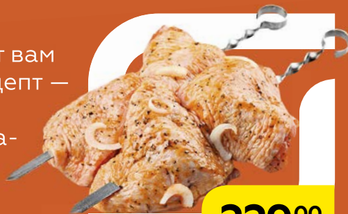
Полуфабрикат ШАШЛЫК КУРИНЫЙ, в маринаде, охлажденная, 1 кг

Нежное мясо в сочетании с пикантным маринадом покорит сердца всех ваших гостей.