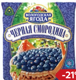
Смордина черная КРУЖЕВО ВКУСА, быстрозамороженная, 300 г