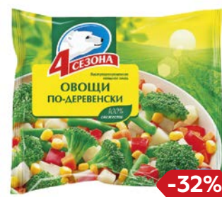
Смесь овощная 4 СЕЗОНА, Овощи по-деревенски, замороженные, 400 г