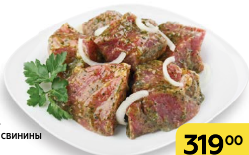
Полуфабрикат ШАШЛЫК ИЗ СВИНИНЫ в маринаде «Французский сад», 1 кг