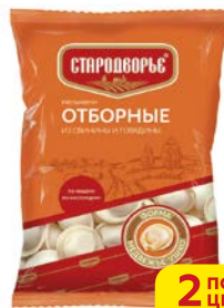
Пельмени СТАРОДВОРСКИЕ, Отборные, свинина-говядина, 430 г