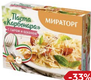
Паста карбонара МИРАТОРГ, С сыром и беконом, 350 г