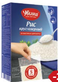
Рис УВЕЛКА, Круглозерный шлифованный, 5 пакетиков x 80 г