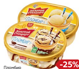
Пломбир ЗОЛОТОЙ СТАНДАРТ, Классический/ Суфле и шоколадный наполнитель, 475 г