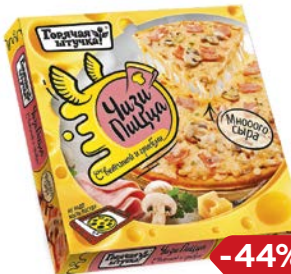
Чизпицца ГОРЯЧАЯ ШТУЧКА, с ветчиной и грибами, 330 г