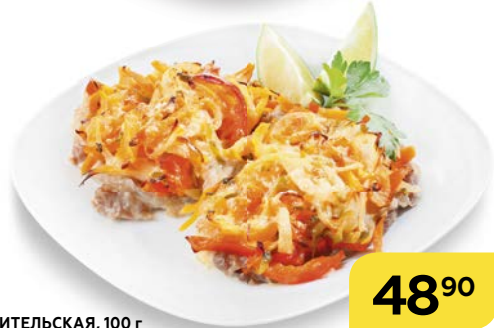
Свинина ЛЮБИТЕЛЬСКАЯ, 100 г