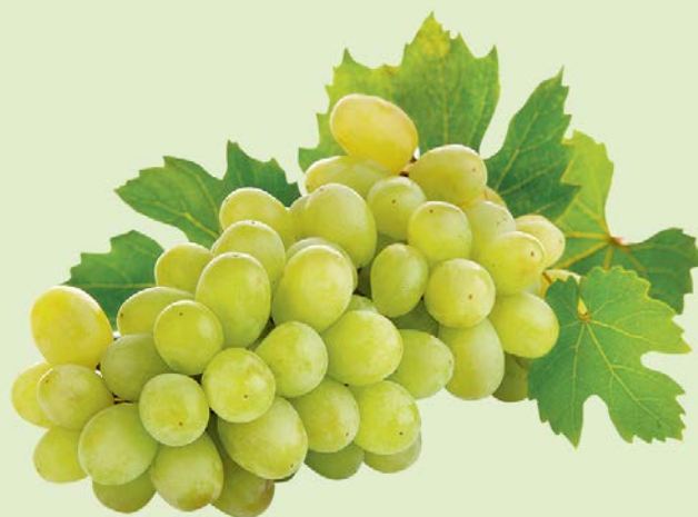
ВИНОГРАД БЕЛЫЙ, 1 кг