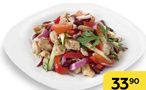
Салат МЮНХЕН, 100 г