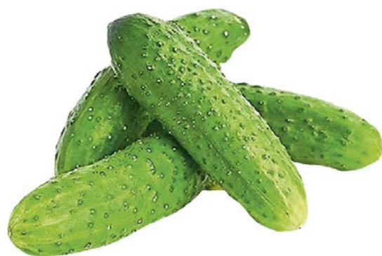
ОГУРЦЫ, короткоплодные пупырчатые, 1 уп. (450 г)