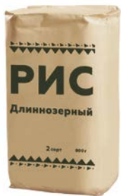
РИС длиннозерный, 800 г