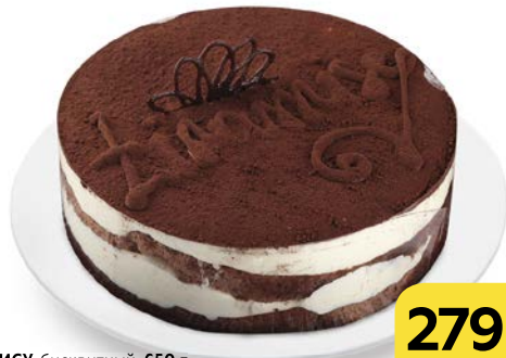
Торт ТИРАМИСУ, бисквитный, 650 г