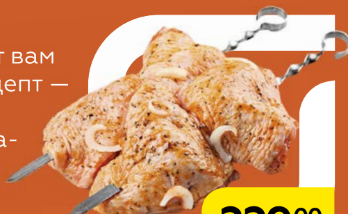
Полуфабрикат ШАШЛЫК КУРИНЫЙ, в маринаде, охлажденная, 1 кг

Нежное мясо в сочетании с пикантным маринадом покорит сердца всех ваших гостей.