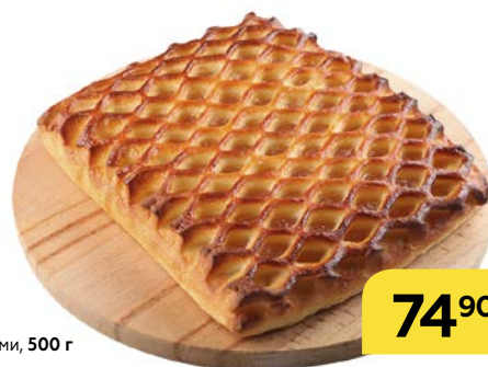
ПИРОГ с яблоками, 500 г