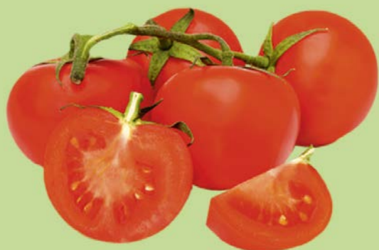
ТОМАТ на ветке, 1 кг