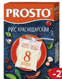
Рис ПРОСТО , Краснодарский, 8 пакетиков x 62,5 г