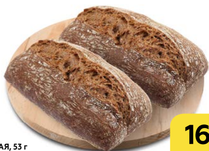
Булка РИЖСКАЯ, 53 г