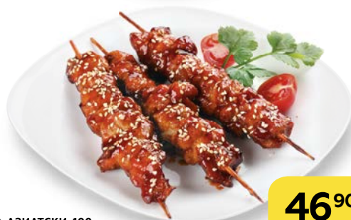
Курица ПО-АЗИАТСКИ, 100 г