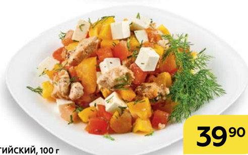
Салат БЕЛЬГИЙСКИЙ, 100 г