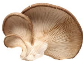
ГРИБЫ ВЕШЕНКИ, 1 уп. (300 г)