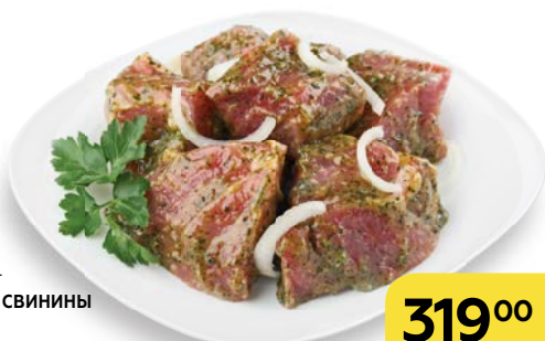
Полуфабрикат ШАШЛЫК ИЗ СВИНИНЫ в маринаде «Французский сад», 1 кг