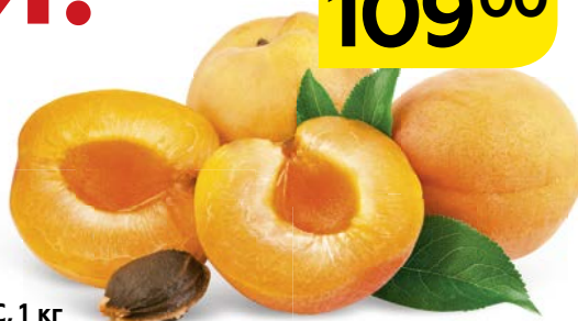
АБРИКОС, 1 кг

Рекламная акция «Магнит семейный» 26 июня – 02 июля 2019 г.