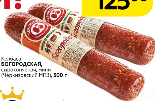
Колбаса БОГОРОДСКАЯ, сырокопченая, мини (Черкизовский МПЗ), 300 г