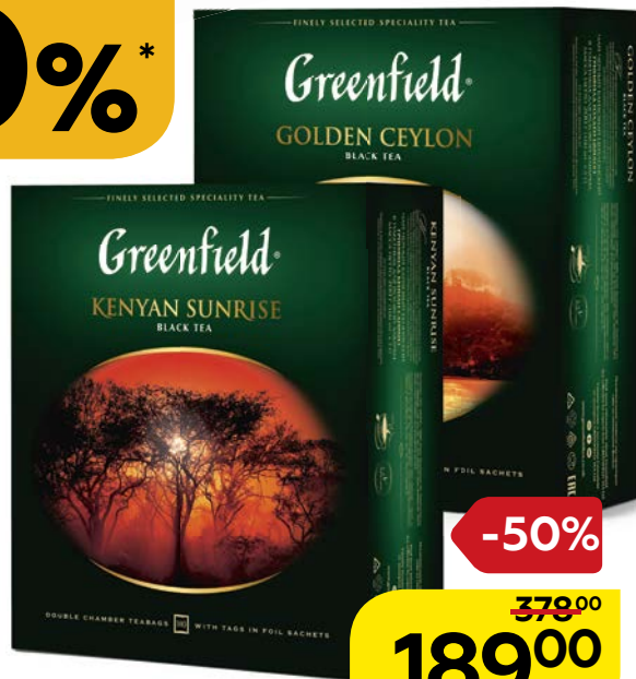
Чай черный ГРИНФИЛД, Кениан Санрайз/ Голден Цейлон, 100 пакетиков