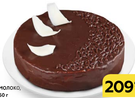
Торт ПТИЧЬЕ МОЛОКО , бисквитный, 650 г