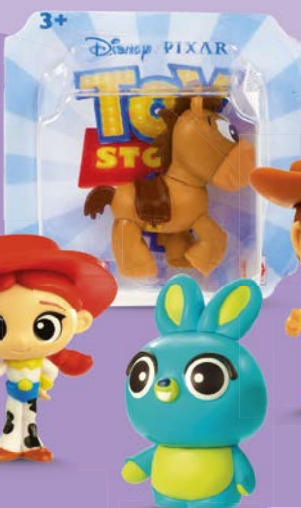
Мини-фигурки ИСТОРИЯ ИГРУШЕК-4 , в ассортименте***