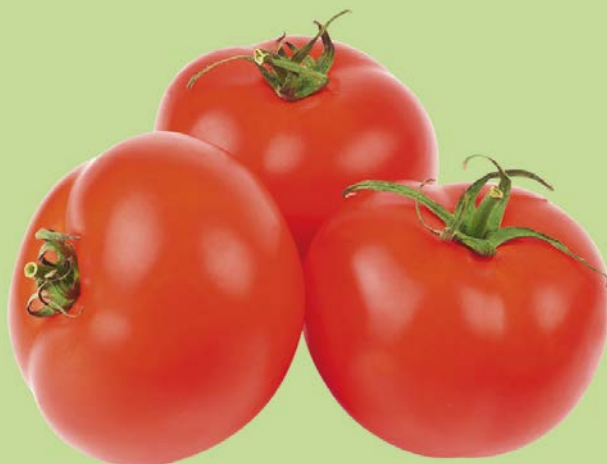
ТОМАТ, 1уп. (600г.)