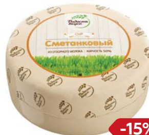
Сыр РАДОСТЬ ВКУСА , Сметанко- вый, 45%, 100 г