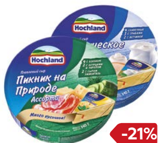
Сыр плавленный ХОХЛАНД , в ассортименте***, 140 г