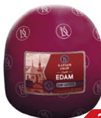
Сыр ЭДАМ (Карлов Двор), 100 г