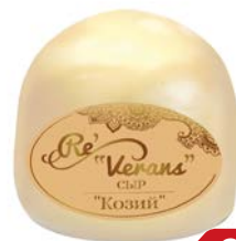
Сыр РЕВЕРАНС , Карлов Двор, из козьего молока, 45% (Ровеньки МСЗ), 100 г