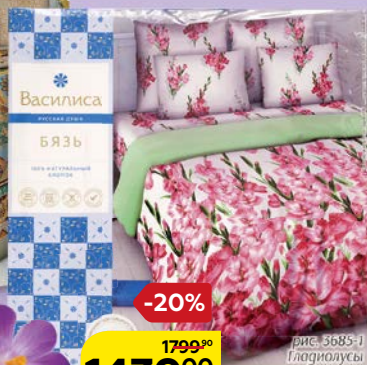
Комплект постельного белья ВАСИЛИСА , 1,5-спальное, бязь