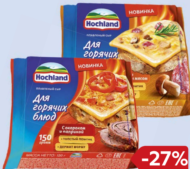
Сыр плавленный ХОХЛАНД , С гри- бами и копченым мясом/ С окороком и паприкой, 45%, 150 г