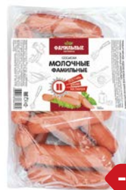
Сосиски МОЛОЧНЫЕ (Фамильные колбасы), 100 г