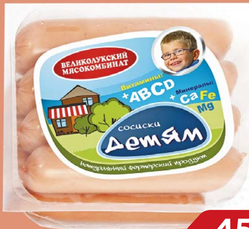
Сосиски ДЕТЯМ (Великолукский МК), 330 г