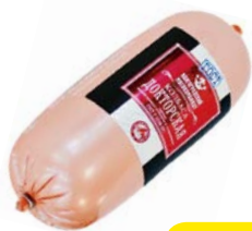
Колбаса ДОКТОРСКАЯ, ГОСТ, мини (Волгоградский мясокомбинат), 400 г