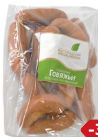
Сардельки ГОВЯЖЬИ (Волгоградский МК), 100 г