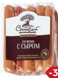
СОСИСКИ с сыром, вареные (Сочи-ский МК), 525 г