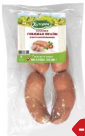
Сардельки ГОВЯЖЬИ ПРАЙМ, мини (Хуторок), 100 г