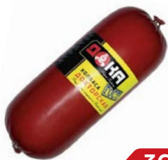
Колбаса ДОКТОРСКАЯ вареная ГОСТ (Волгоградский МК), 100 г