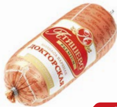
Колбаса ДОКТОРСКАЯ, вареная, премиум (Атяшево), 500 г

*Цена за единицу товара при елиментарной покупке 2-х одинаковых акционных товаров