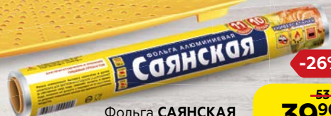
Фольга САЯНСКАЯ универсальная, 10 м