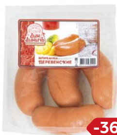
Шпикачки ДЕРЕВЕНСКИЕ, Дым Дымыч, Мини (Агротэк), 100 г