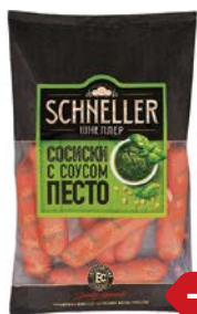
Сосиски ШНЕЛЛЕР с соусом Песто, 450 г