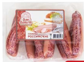
Сосиски РОССИЙСКИЕ, Дым Дымыч (Агротэк), 500 г