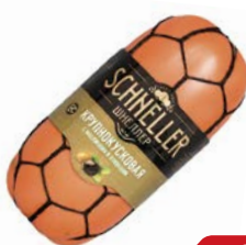
Колбаса ШНЕЛЛЕР крупнокусковая с маслинами и оливками вареная, 550 г