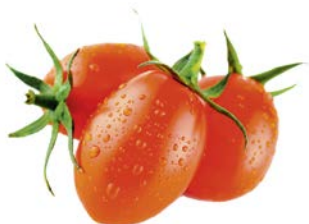
ТОМАТЫ, сливовидные, 1 уп. (600 г)