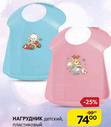
НАГРУДНИК детский, пластиковый