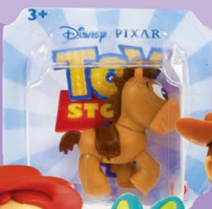
Мини-фигурки ИСТОРИЯ ИГРУШЕК-4 , в ассортименте***