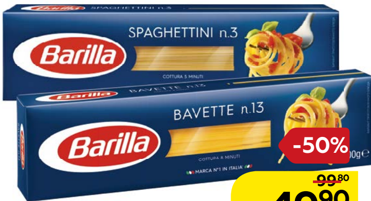
Макаронные изделия БАРИЛЛА, Спагетти/ Спагеттини/ Спагеттони/Капеллини/Баветте/, 500 г