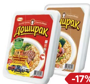
Лапша ДОШИРАК Телятина/ Говядина/ Курица, 90 г