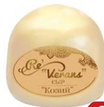
Сыр РЕВЕРАНС , Карлов Двор, из козьего молока, 45% (Ровеньки МСЗ), 100 г