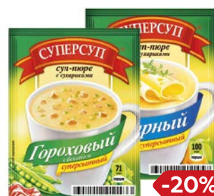
Суп-пюре СУПЕРСУП, с сухариками: Сырный, 26,5 г/ Гороховый, 23 г