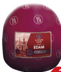
Сыр ЭДАМ (Карлов Двор), 100 г