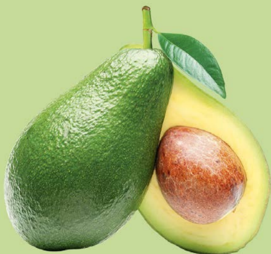
АВОКАДО, 100 г