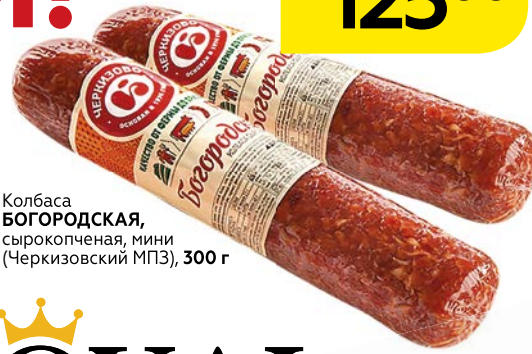
Колбаса БОГОРОДСКАЯ, сырокопченая, мини (Черкизовский МПЗ), 300 г