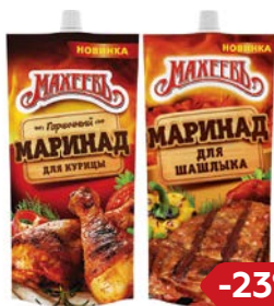
Маринад МАХЕЕВЪ, Горчиный для курицы/Для шашлыка, 300 г