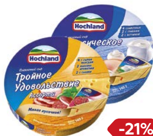
Сыр плавленный ХОХЛАНД , в ассортименте***, 140 г