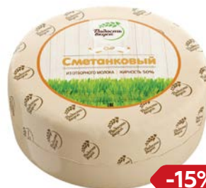
Сыр РАДОСТЬ ВКУСА , Сметанко- вый, 45%, 100 г