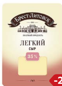
Сыр БРЕСТ-ЛИТОВСК , Легкий, 35%, Нарезка, 150 г