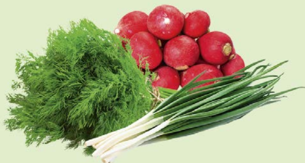
НАБОР ДЛЯ ОКРОШКИ (лук, укроп, редис), 1 шт. (150 г)