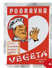
Приправа универсальная ВЕГЕТА, 75 г