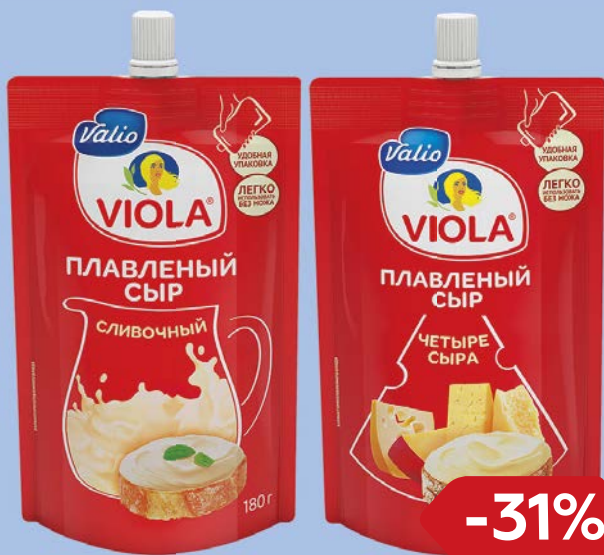
Сыр ВИОЛА Четыре сыра/ Сливочный, 180 г