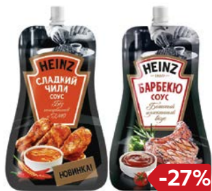
Соус ХАЙНЦ Барбекю/ Сальса/ Сладкий чили, 230 г