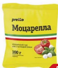
Сыр МОЦАРЕЛЛА , Претто, Чильде- жина, 45%, 100 г