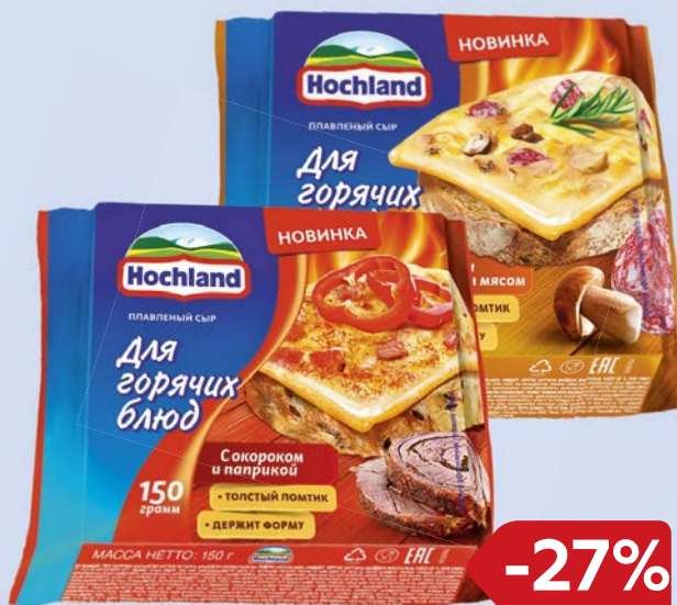
Сыр плавленный ХОХЛАНД , С гри- бами и копченым мясом/ С соко- роком и паприкой, 45%, 150 г