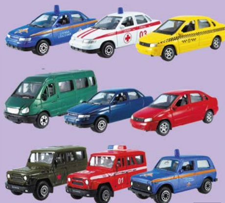
Авто РФ легковые специальные/ легковые гражданские/ внедорожники, специальные, 1:60, в ассортименте***