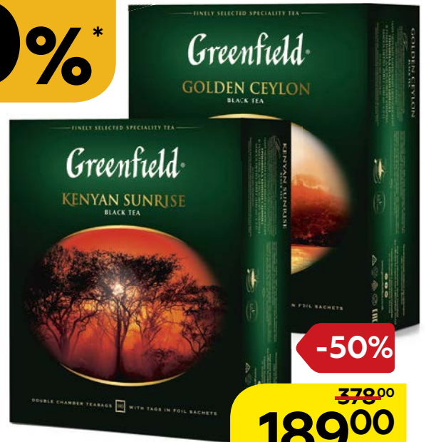
Чай черный ГРИНФИЛД, Кениан Санрайз/ Голден Цейлон, 100 пакетиков