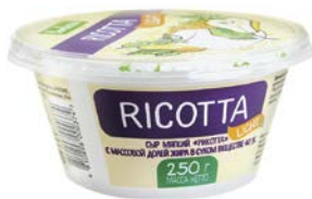
Сыр РИКОТТА БОНФЕСТО , Лайт, 40%, 250 г