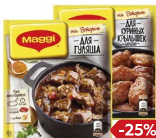
Приправа МАГГИ® в ассортименте***, 24 г/ 37 г/ 30 г/ 26 г