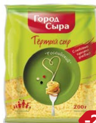
Сыр РОССИЙСКИЙ тертый 45% (Город Сыра), 200 г