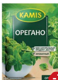
Орегано КАМИС, 10 г