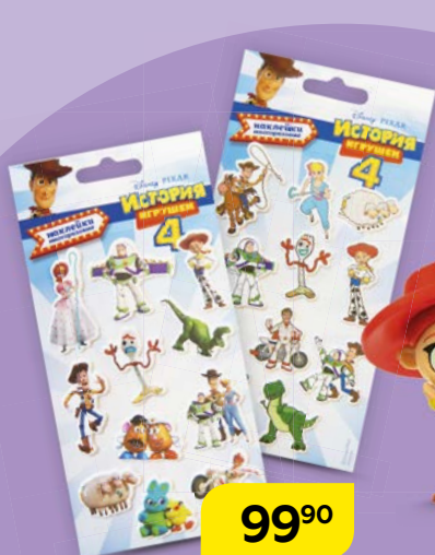
Наклейки ИСТОРИЯ ИГРУШЕК , в ассортименте***