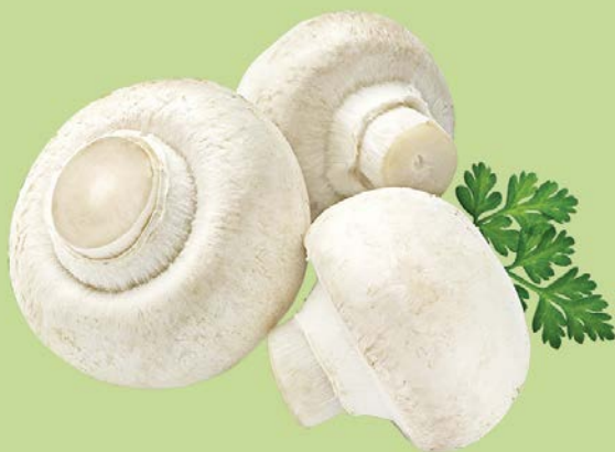
ШАМПИНЬОНЫ, 1уп. (400 г)