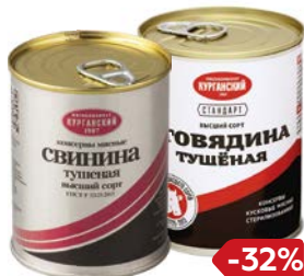
СТАНДАРТ , высший сорт, тушеная: Свинина / Говядина (Курганский МК), 338 г