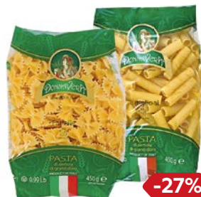
Макаронные изделия DONNA VERA®, Бантики/ рифленые/ Спагетти тонкие, 450 г