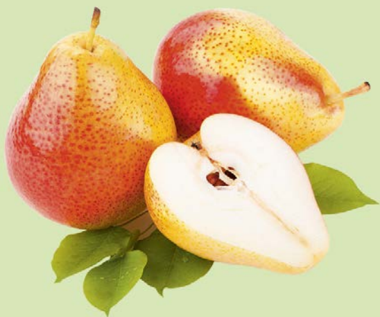
ГРУША ФОРЕЛЬ, 1кг