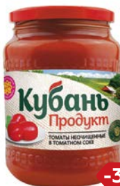
Томаты КУБАНЬ ПРОДУКТ , Неочищенные в томатном соке, 680 г