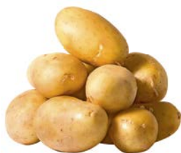
КАРТОФЕЛЬ молодой, 1кг