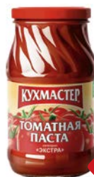
Паста томатная КУХМАСТЕР , 480 г