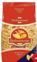
Макаронные изде- лия ШЕБЕКЕНСКИЕ, Бабочки, №400, 350 г