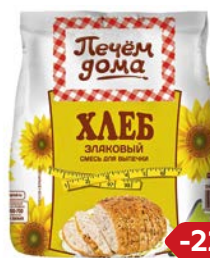
Смесь для выпечки ПЕЧЕМ ДОМА, Хлеб злаковый, 500 г