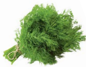
УКРОП, 1уп. (100 г)