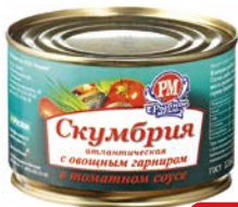
Консервы РЫБНОЕ МЕНЮ , Скумбрия с овощным гарниром в томатном соусе, 250 г