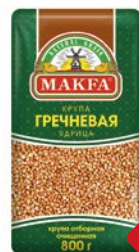
Крупа гречневая МАКФА®, ядрица, 800 г