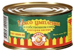
Мясо цыпленка ЗОЛОТОЙ ПЕТУШОК , В собственном соку, 325 г