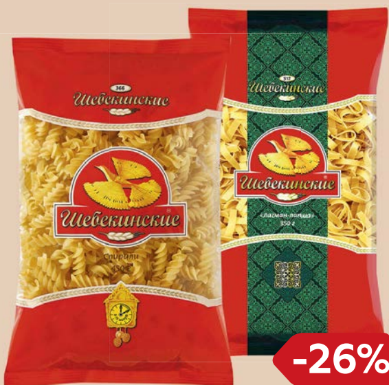
ШЕБЕКЕНСКИЕ, Легман-лапша, 350 г/ Спирали, 450 г