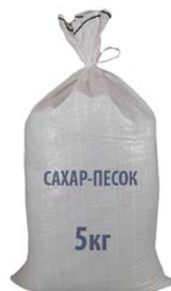
САХАР-ПЕСОК, 5 кг