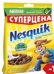
Завтрак готовый НЕСКВИК, Шарик шоколадные, 250 г