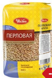
Крупа перловая УВЕЛКА, 800 г