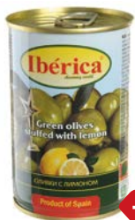
Оливки ИБЕРИКА , Зеленые с лимоном, 300 г