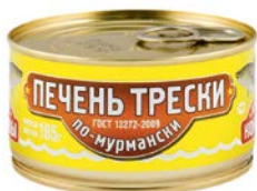
Печень трески ВКУСНЫЕ КОНСЕРВЫ По-мурмански, 185 г