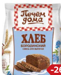
Смесь для выпечки ПЕЧЕМ ДОМА хлеб бородинский, 500 г