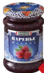
Варенье ЭКОПРОДУКТ , Малина, 325 г