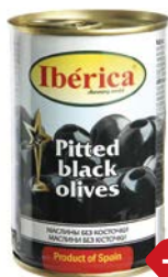
Маслины ИБЕРИКА , Без косточки, 300 г