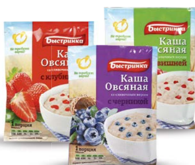
Каша овсяная БЫСТРИНКА , в ассортименте***, 41 г