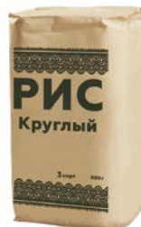
РИС, Круглый, 3 сорт, 800 г