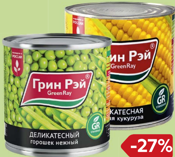
ГРИН РЭЙ , Горошек / Кукуруза, 400 г