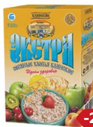
Хлопья овсяные КЛИНСКИЕ экстра №2, 500 г