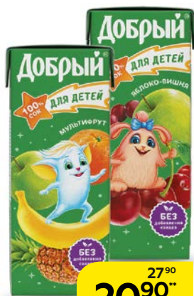
Сок ДОБРЫЙ , в ассортименте***, 200 мл