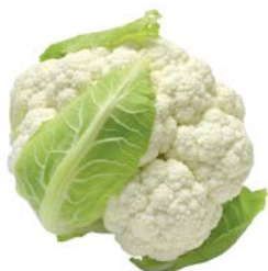
КАПУСТА ЦВЕТНАЯ, 1кг