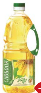
Масло подсолнеч- ное СЛОБОДА, рафинированное, дезодорирован- ное, 1,8 л