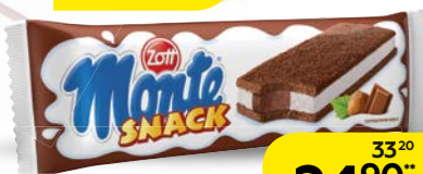
Пирожное ЦОТТ , Монте Снэк, ореховое, 29 г