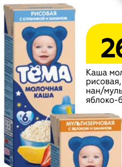
Каша молочная ТЁМА ****, рисовая, клубника-банан/мультизерновая, яблоко-банан, 206 г