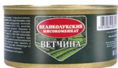
Ветчина ВЕЛИКОЛУКСКИЙ МК , 325 г