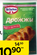
Дрожжи DR.OETKER, Сухие, 7 г