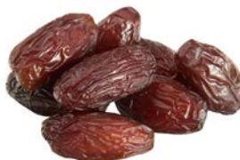
ФИНИКИ, 1уп. (400 г)