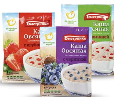
Каша овсяная БЫСТРИНКА , в ассортименте***, 41 г