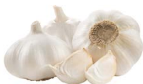
ЧЕСНОК, 1 кг