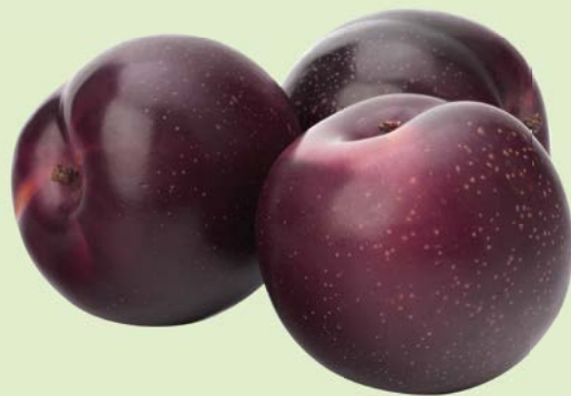
СЛИВА, 1 кг