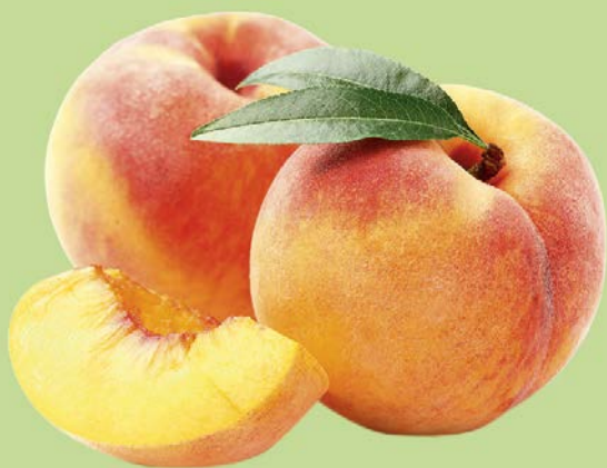
ПЕРСИК, 1 кг