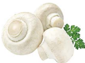
ШАМПИНЬОНЫ, ГРИЛЬ, 1уп. (800г)