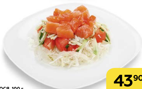
Салат из ЛОСОСЯ , 100 г