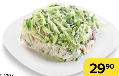
Салат ФАВОРИТ , 100 г