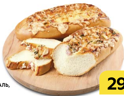
Батон ПРОВАНСАЛЬ , с ветчиной, 150 г