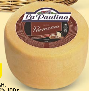
Сыр ПАРМЕЗАН, Ла Паулина, 45%, 100 г