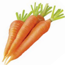
МОРКОВЬ, фасованная, 1кг