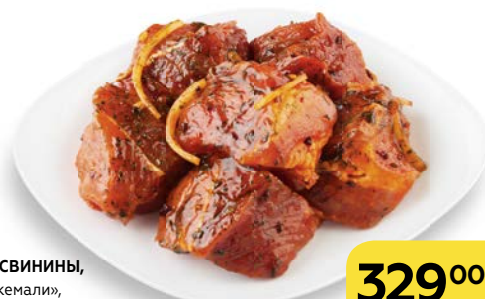
Полуфабрикат ШАШЛЫК ИЗ СВИНИНЫ , в маринаде «Ткемали», из лопатки, 1 кг