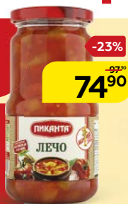
Лечо ПИКАНТА, 520 г