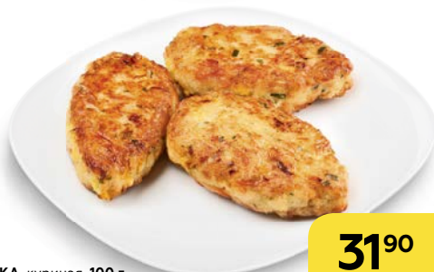
Котлета ЗАГАДКА , куриная, 100 г