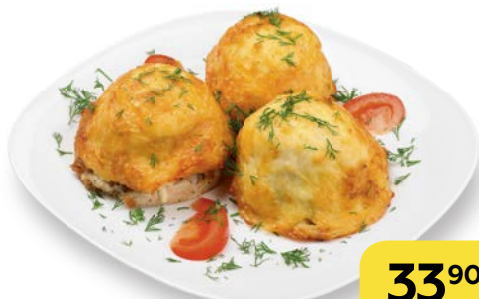
Отбивная ПО-КРИОЛЬСКИ , 100 г