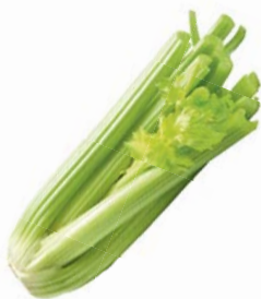
СЕЛЬДЕРЕЙ СТЕБЕЛЬ, 1уп. (300-600 г)