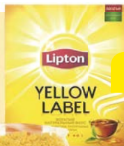
Чай черный ЛИПТОН, Йеллоу Лэйбл, 100 пакетиков