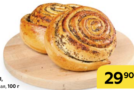
Сдоба ЛЮБИМАЯ , с начинкой маковая, 100 г