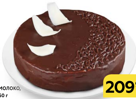
Торт ПТИЧЬЕ МОЛОКО , бисквитный, 650 г