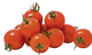
ТОМАТЫ, ЧЕРРИ, 1уп. (250г)