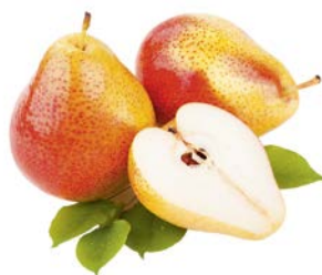
ГРУША ФОРЕЛЬ, 1кг