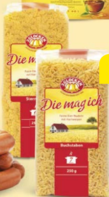
Макаронные изделия 3 ГЛОКЕН мелкие звездочки/ алфавит, 250 г