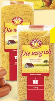
Макаронные изделия 3 ГЛОКЕН мелкие звездочки/ алфавит, 250 г