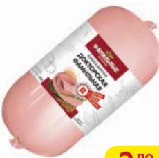
Колбаса ДОКТОРСКАЯ ФАМИЛЬНАЯ (Фамильные колбасы), 400 г