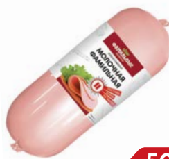
Колбаса МОЛОЧНАЯ, Фамильная, мини (Фамильные колбасы), 100 г