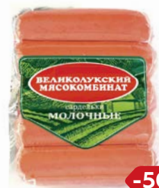
Сардельки МОЛОЧНЫЕ (Великолукский МК), 500 г