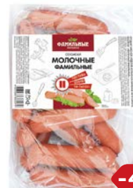
Сосиски МОЛОЧНЫЕ (Фамильные колбасы), 600 г