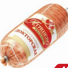
Колбаса ДОКТОРСКАЯ, вареная, премиум (Атышево), 500 г