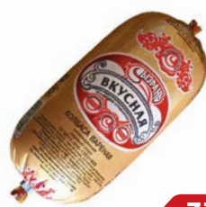
Колбаса ВКУСНАЯ, варе- ная (Сызранский МК), 700 г