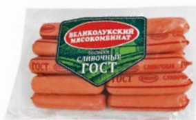
Сосиски СЛИВОЧНЫЕ, ГОСТ (Велико- лукский МК), 650 г

* Цена за единицу товара при единичной покупке 2 одинаковых акционных товаров