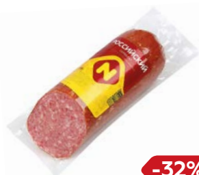
Сервелат РОССИЙСКИЙ Варено-копченый (ОМПК), 420 г