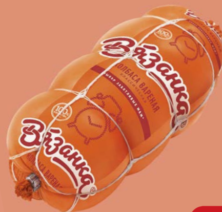
Колбаса КЛАСИЧЕСКАЯ, Вязанка, вареная (Стародворские Колбасы), 500 г