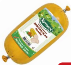
Колбаса ДОКТОРСКАЯ, Прайм, Хуторок (Фамильные колбасы), 450 г