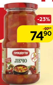
Лечо ПИКАНТА, 520 г