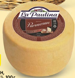
Сыр ПАРМЕЗАН, Ла Паулина, 45%, 100 г