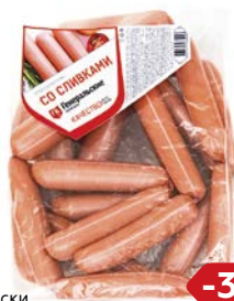
Сосиски СО СЛИВКАМИ, Классические, Генеральские колбасы (Агротэк), 100 г