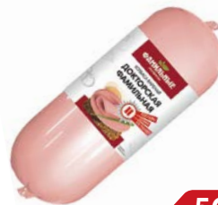
Колбаса ДОКТОРСКАЯ ФАМИЛЬНАЯ, (Фамильные колбасы), 100 г