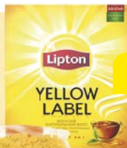
Чай черный ЛИПТОН, Йеллоу Лэйбл, 100 пакетиков