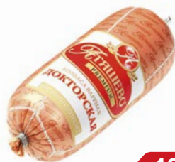
Колбаса ДОКТОРСКАЯ, вареная, премиум (Атяшево), 500 г