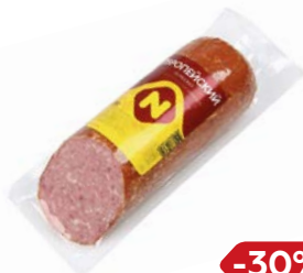
Сервелат ЕВРОПЕЙСКИЙ, варено-копченый (ОМПК), 420 г