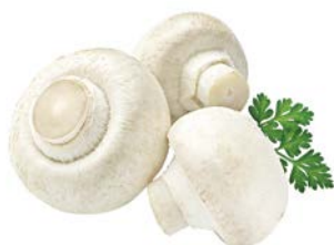
ШАМПИНЬОНЫ, 1уп. (400 г)