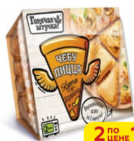
Чебурица ГОРЯЧАЯ ШТУЧКА, Курочка по-итальянски, 250г