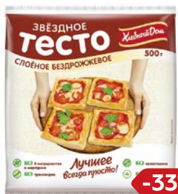
Тесто слоеное ЗВЕЗДНОЕ, Бездрожжевое (Фацер), 500г

* Цена за единицу товара при одновременной покупке 2 одинаковых акционных товаров