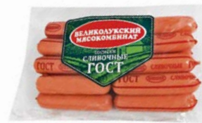
Сосиски СЛИВОЧНЫЕ, ГОСТ (Велико- лукский МК), 650 г