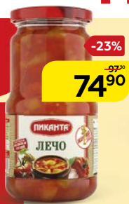
Лечо ПИКАНТА, 520 г