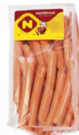
Сосиски ФИЛЕЙНЫЕ, Из мяса птицы, 1 сорт (ОМПК), 100 г