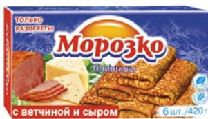
Блины МОРОЗКО, с ветчиной и сыром, 420г

* Цена за единицу товара при одновременной покупке 2 одинаковых акционных товаров