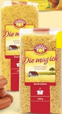
Макаронные изделия 3 ГЛОКЕН мелкие звездочки/ алфавит, 250 г