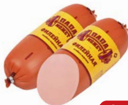
Колбаса ФИЛЕЙНАЯ, Папа может, из мяса птицы (ОМПК), 100 г