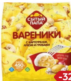
Вареники СЫТЫЙ ПАПА, с картофелем, луком и грибами, 450г