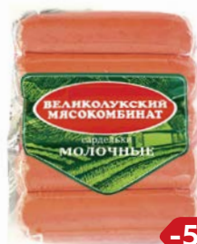
Сардельки МОЛОЧНЫЕ (Великолукский МК), 500 г