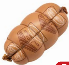
Колбаса ДОКТОРСКАЯ, ГОСТ вареная (Великолукский МК), 500 г