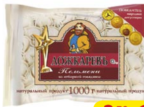
Пельмени ЛОЖКАРЕВЪ, из отборной говядины (Шельф), 1кг