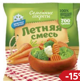
Смесь овощная СЕМЕЙНЫЕ СЕКРЕТЫ, Летняя, замороженная, 700г