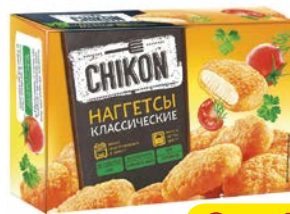
Наггетсы ЧИКОН Классические, 300г