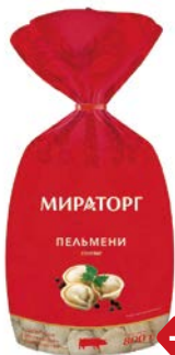
Пельмени МИРАТОРГ, Свиные, 800г