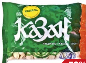
Пельмени КАЗАН, Хальяль (ИП Пчелин П. В.), 1кг

* Цена за единицу товара при одновременной покупке 2 одинаковых акционных товаров