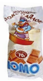
Мороженое ЮМО, Шоколадное, стаканчик, 70г