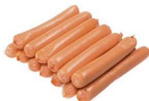
Сосиски МОЛОДЕЖНЫЕ вареные (ИП Логинов), 100 г