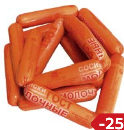
Сосиски МОЛОЧНЫЕ (ИП Логинов), 100 г