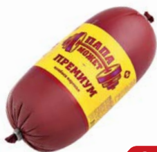
Колбаса ПРЕМИУМ, Папа может, Вареная (ОМПК), 500 г