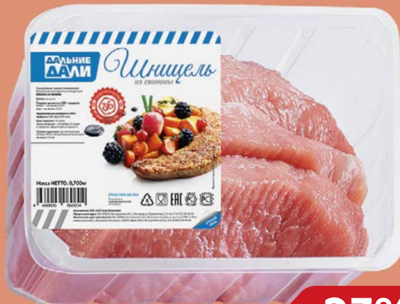
Шницель ДАЛЬНИЕ ДАЛИ, из свинины (Агро-белогорье), 700 г