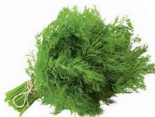
УКРОП, 1уп. (100г)