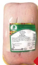
ГРУДКА цыпленка- бройлера охлажденная (СИТНО), 1кг