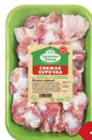
Желудки куриные ЗДОРОВАЯ ФЕРМА, Охлаж- денные, 500г