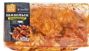
Шашлык ТРАДИЦИОННЫЙ, охлажденный (Ариант Агро), 1кг