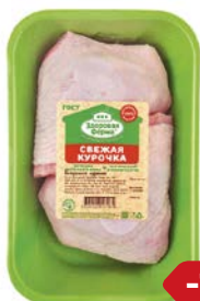
Бедро цыпленка- бройлера ЗДОРОВАЯ ФЕРМА, Охлаж- денное, 1кг