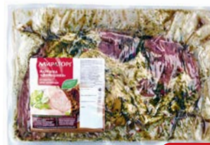
Лопатка для запекания ДОМАШНЯЯ, Охлажденная (Мираторг), 1кг