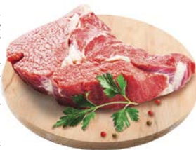
Полуфабрикат** ГОВЯДИНА, Лопаточная часть, без кости, охлажденная, 1кг

Представлен вариант сервировки продукции