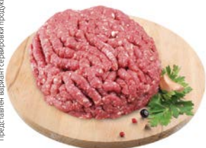
Полуфабрикат фарш** ДОМАШНИЙ, охлажденный, 1кг

Представлен вариант сервировки продукции