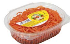
Салат МОРКОВЬ ПО-КОРЕЙСКИ (ООО Кореяна), 200г