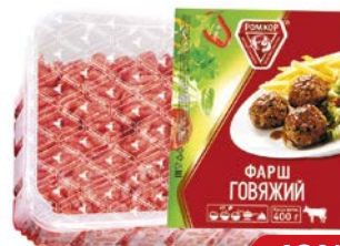
Фарш ГОВЯЖИЙ охлажденный (Ромкор), 400г