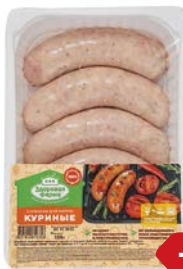
Колбаски для жарки ЗДОРОВАЯ ФЕРМА, куриные, охлажденные, 500г