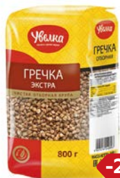
Гречка УВЕЛКА, Экстра, 800 г