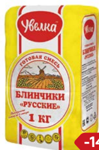
Мука УВЕЛКА, блинная, (Блинчики Русские), 1 кг