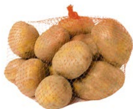
КАРТОФЕЛЬ, фасованный, 1кг