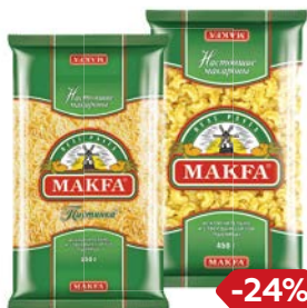
Макароны МАКФА® Вермишель короткая тонкая/ Петушинные гребешки/ Улитки, 450 г