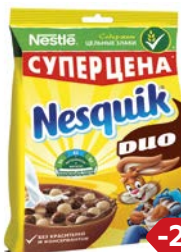
Завтрак готовый НЕСКВИК, Дуо Шарики молочные и шоколадные, 250 г