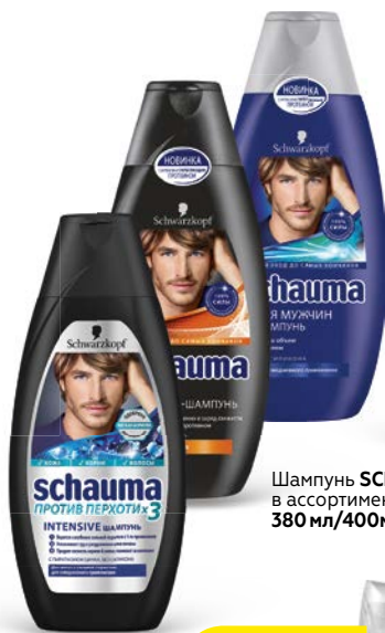
Шампунь SCHAUMA® , в ассортименте*, 380 мл/400мл