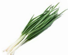
ЛУК ЗЕЛЕНый, 1уп. (100г)