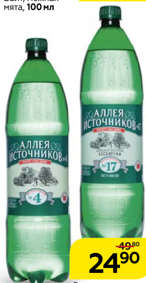
Вода минеральная АЛЛЕЯ ИСТОЧНИКОВ , №4/ №17, 1,5 л