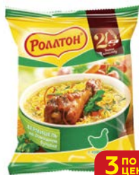
Лапша РОЛЛТОН, со вкусом курицы, 60 г