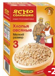
Хлопья овсяные ЯСНО СОЛНЫШКО, №3, 350 г