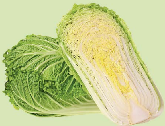
КАПУСТА ПЕКИНСКАЯ, 1кг