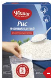
Рис УВЕЛКА, Длиннозерный, шлифованный, 5 пакетиков x 80 г