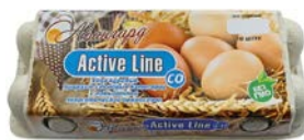
Яйцо куриное АВАНГАРД Актив лайн СО, 10 шт.