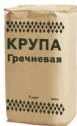
Крупа ГРЕЧНЕВАЯ, 800 г