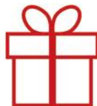
ФОТО В INSTAGRAM С ХЕШТЕГОМ #РАСТИСИГРУШКОЙ