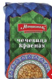
Чечевица НАЦИОНАЛЬ, красная, 450 г