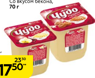
Пудинг ЧУДО , Ваниль/ Карамель/ Шоколад, 125 г