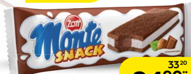
Пирожное ЦОТТ , Монте Снэк, ореховое, 29 г