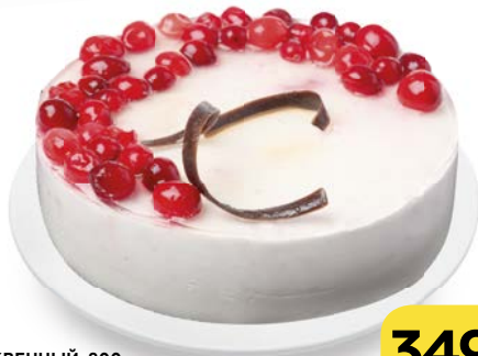
Торт бисквитный ЧИЗКЕЙК КЛЮКВЕННЫЙ , 800 г