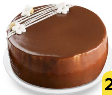
Торт бисквитный ШОГАНА , 850 г