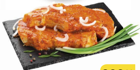
Полуфабрикат шашлык « ТОРРЕС », в маринаде «Горчично-сладкий», 1 кг