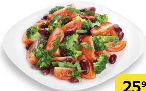
Салат МАНХЭТТЕН , 100 г