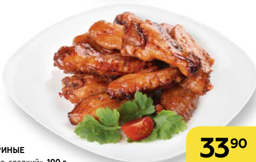
КРЫЛЬЯ КУРИНЫЕ в соусе «Кисло-сладкий», 100 г