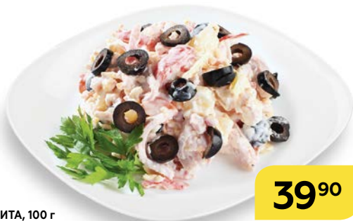
Салат МАРГАРИТА , 100 г