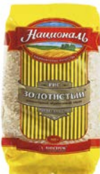
Рис НАЦИОНАЛЬ , Золотистый, 900 г