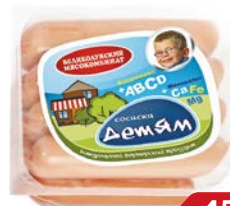
Сосиски ДЕТЯМ (Великолукский МК), 330г