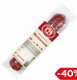
Колбаса ПРЕОБРАЖЕНСКАЯ , сырокопченая (ЧМПЗ), 300г