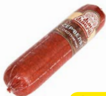
Сервелат ОХОТНИЧИЙ Дым Дымыч варено-копченый, мини (Агротэк), 350г