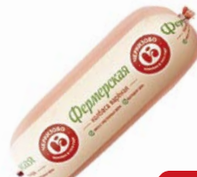
Колбаса ФЕРМЕРСКАЯ , Вареная (ЧМПЗ), 500г