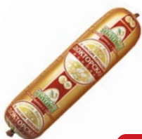
Колбаса ДОКТОРСКАЯ , Особая, с мясом птицы (Удмуртская ФФ), 400г

* Цена за единицу товара при единичной покупке 2-х одинаковых экземпляров товаров