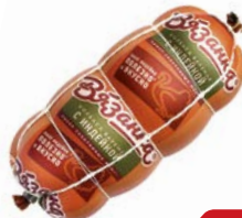
Колбаса ВЯЗАНКА вареная с индейкой (Старо- дворские колбасы), 450г