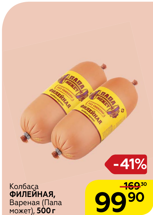
Колбаса ФИЛЕЙНАЯ , Вареная (Папа может), 500г