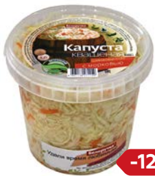
Капуста квашеная БЕЛУРУЧКА , С морковью, 1кг