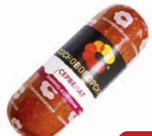
Сервелат СОСНОВОБОРСКИЙ , Варено-копченый (Камский МК), 350г