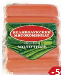
Сардельки МОЛОЧНЫЕ (Великолукский МК), 500г