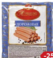
Сосиски ДОРОЖНЫЕ (МПК Атяшевский), 600г