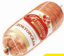
Колбаса ДОКТОРСКАЯ , вареная, премиум (МПК Атяшевский), 500г

* Цена за единицу товара при единичной покупке 2-х одинаковых экземпляров товаров