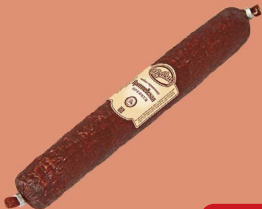
Колбаса КРЕМЛЕВСКАЯ , Премиум сырокоп- ченая (МК Дубки), 100 г