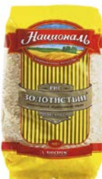
Рис НАЦИОНАЛЬ , Золотистый, 900 г