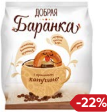
Баранки ДОБРАЯ БАРАНКА аромат калуцино, 350 г