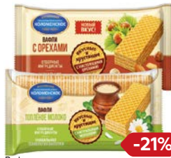
Вафли КОЛОМЕНСКОЕ С орехами, 200 г/ Топленое молоко, 220 г