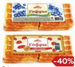
Вафли АЛАДУШКИН Гофры с суфле: с вишней/ с черникой/ с клубникой, 122 г