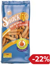
Палочки СЕКЛАЙФ с солью, 150 г