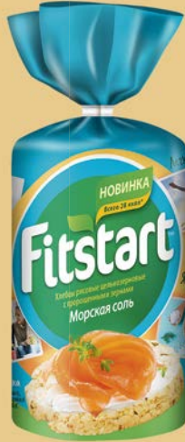
Хлебцы ФИТСТАРТ Рисовые: Прованские травы/ Морская соль, 90 г