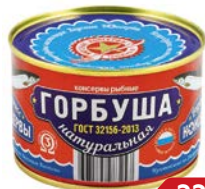
ГОРБУША натуральная (Большеекамский РЗ), 245 г