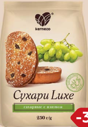
Сухари КЕРНЕКО Люкс, сахарные с изюмом, 250 г