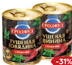
ГРОДФУД Тушеная с перцем чили: Свинина/Говядина, 338 г