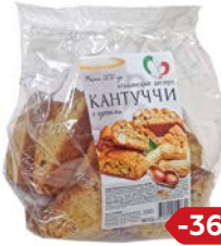
Сухари КАНТУЧЧИ с орехами, 200 г