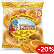
Баранки ВОЛЖСКИЕ яичные, 350 г