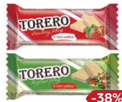
Вафли ТОРЕРО нежные, мини: С орехом/ Клубничные/ Аромат ванили, 35 г