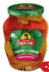
Перец сладкий ДЯДЯ ВАНЯ маринованный, 680 г