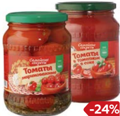
Томаты СЕМЕЙНЫЕ СЕКРЕТЫ, Маринованные/ Неочищенные в томатном соке, 680 г