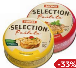
Паштет КАРНЕКС Селекшн: куриный / с копченым беконом, 95 г