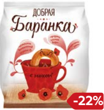
Баранки ДОБРАЯ БАРАНКА с макамо, 350 г