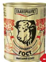
Говядина тушеная, Высший сорт, ГОСТ, 338 г