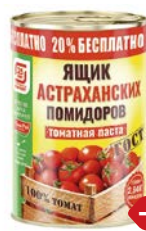
Паста томатная ЯЩИК АСТРАХАНСКИХ ПОМИДОРОВ, 410 г