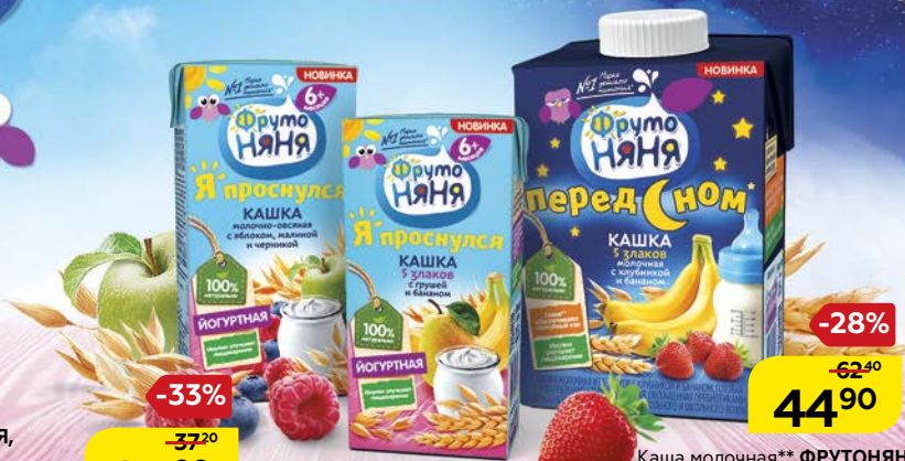
Каша йогуртная** ФРУТОНЯНЯ, 5 злаков с грушей и бананом/ Молочно-овсяная с яблоком, малиной и черникой, 200 мл

100% натурально ЙОГУРТНАЯ Ингулин улучшает пищеварение