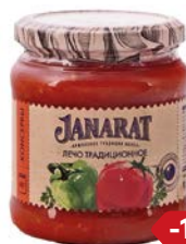
Лечо ДЖАНАРАТ традиционное, 460 г