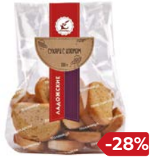
Сухари ЛАДЖСКИЕ с изюмом, 250 г