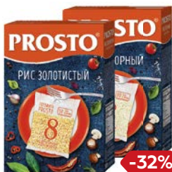
Рис PROSTO® , Золотистый/Отборный, 8 пакетиков x 62,5г