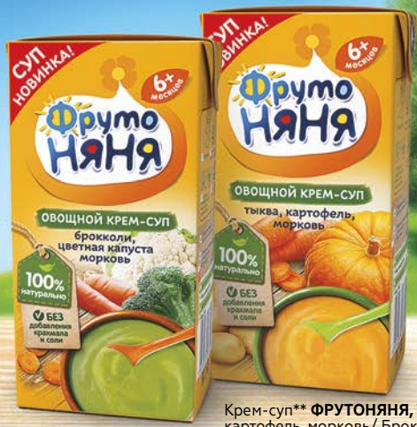
Крем-суп** ФРУТОНЯНЯ, Тыква, картофель, морковь/ Брокколи, цветная капуста, морковь, 200 мл

✓ Только разогреть! ✓ Предложите «овощной крем-суп»* малышу на обед ✓ Прекрасно сочетается с мясными пюре ФрутоНяня