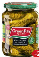
Огурцы ГРИН РЭЙ, Маринованные, 670 г