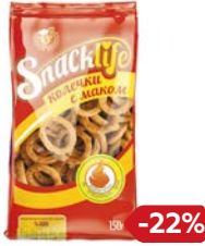
Колечки СЕКЛАЙФ с макамо, 150 г