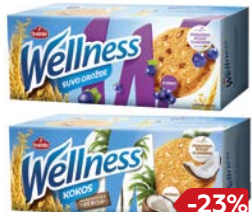
Печенье ВЕЛЛНЕСС злаковое с витаминами: Кокос/ Овсяные хлопья/ Изюм, 210 г