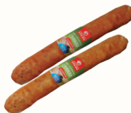
КОЛБАСА "СВИНАЯ" ВНМД, П/К, 240 ГР