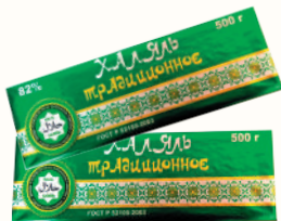
СПРЕД "ХАЛЯЛЬ ТРАДИЦИОННОЕ" РАСТИТЕЛЬНО-ЖИРОВОЙ 82%, 500 ГР