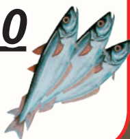
ПУТАССУ С/М, 1 КГ