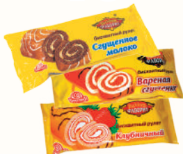
РУЛЕТ БИСКВИТНЫЙ "ВИКТОРИЯ" В АССОРТИМЕНТЕ, 150 ГР