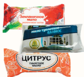
МЫЛО ТУАЛЕТНОЕ В АССОРТИМЕНТЕ, 75-90 ГР