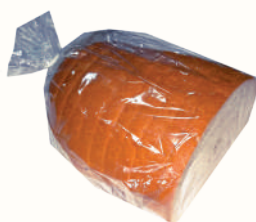
ХЛЕБ "БОКАТО" "ВОЛХОВХЛЕБ", 300 ГР