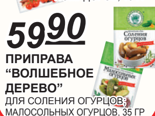
ПРИПРАВА "ВОЛШЕБНОЕ ДЕРЕВО" ДЛЯ СОЛЕНИЯ ОГУРЦОВ; МАЛОСОЛЬНЫХ ОГУРЦОВ, 35 ГР