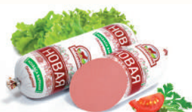
КОЛБАСА "НОВАЯ" САВА, ВАР., 1 КГ