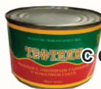
ТЕФТЕЛИ РЫБНЫЕ ОВОЩНЫМ ГАРНИРОМ В Т/С, 230 ГР