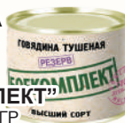
ГОВЯДИНА ТУШЕНАЯ "РЕЗЕРВ БОЕКОМПЛЕКТ" ГОСТ В/С, 525 ГР