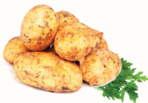
КАРТОФЕЛЬ МОЛОДОЙ, 1 КГ