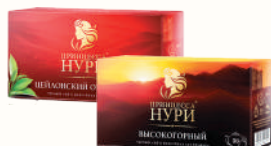
ЧАЙ "ПРИНЦЕССА НУРИ" ОТБОРНЫЙ ЦЕЙЛОНСКИЙ; ВЫСОКОГОРНЫЙ ЧЕРНЫЙ БАЙХОВЫЙ, 30 ПАК. Б/Я