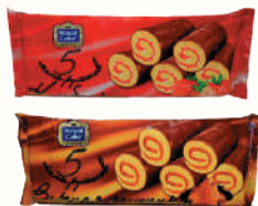
МИНИ РУЛЕТ "РОЯЛ КЕЙК" ГЛАЗИРОВАННЫЕ В АССОРТИМЕНТЕ, 160 ГР