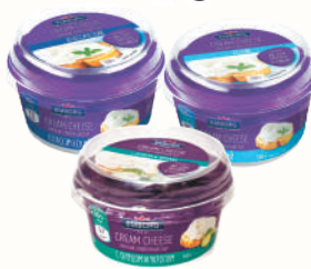
ТВОРОЖНЫЙ СЫР "ЭМБОРГ" МЯГКИЙ СЛИВОЧНЫЙ В АССОРТИМЕНТЕ, 150 ГР