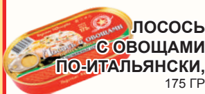
ЛОСОСЬ С ОВОЩАМИ ПО-ИТАЛЬЯНСКИ, 175 ГР