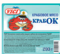
КРАБОВОЕ МЯСО "ВИЧИ" ОХЛ., 200 ГР