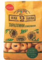
ИЗДЕЛИЕ Х/Б "ТАРАЛЛИНИ" КЛАССИЧЕСКИЕ, 180 ГР