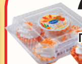
НАБОР ПИРОЖНЫХ "БЕЛАЯ НОЧЬ" "КАРАТ ПЛЮС", 200 ГР