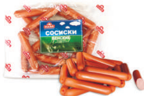
СОСИСКИ "ВЕНСКИЕ" ОХЛ., САВА, 1 КГ