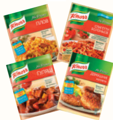
СМЕСЬ НА ВТОРОЕ "КНОРР" ДЛЯ ПРИГОТОВЛЕНИЯ ПЛОВА; СПАГЕТТИ БОЛОНЬЕЗЕ; ДОМАШНИХ КОТЛЕТ; ГУЛЯША, 25-44 ГР