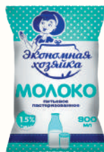
МОЛОКО ПИТЬЕВОЕ 1,5%, 900 МЛ