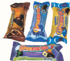
КРЕМ ДЕСЕРТ "СЫРКАЕШ-КА" 23% В АССОРТИМЕНТЕ, 40 ГР