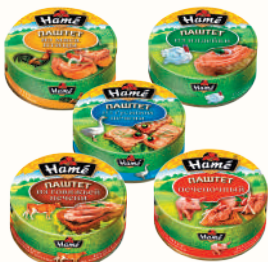
ПАШЕТТ "ХАМЕ" В АССОРТИМЕНТЕ, 117 ГР