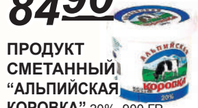
ПРОДУКТ СМЕТАННЫЙ "АЛЬПИЙСКАЯ КОРОВКА" 20%, 900 ГР