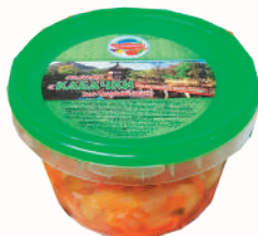
САЛАТ "КАБАЧКИ ПО-КОРЕЙСКИ" "Д-АЛМИРОС", 500 ГР