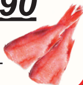
ОКУНЬ БГ С/М, 1 КГ