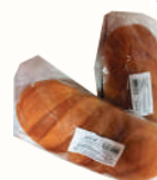
БАТОН НАРЕЗНОЙ 1 СОРТ "ВОЛХОВХЛЕБ", 300 ГР