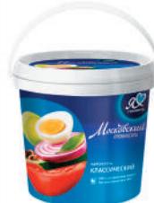
МАЙОНЕЗ "МОСКОВСКИЙ ПРОВАНСАЛЬ" КЛАССИЧЕСКИЙ, 67%, 900 МЛ