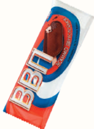
МОРОЖЕНОЕ "ВВП" ДВУХСЛОЙНОЕ ВАНИЛЬНО- ШОКОЛАДНОЕ, 60 ГР