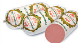
КОЛБАСА "МУСУЛЬМАНСКАЯ" ВАР., САВА, 1 КГ