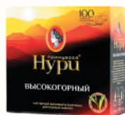
ЧАЙ "ПРИНЦЕССА НУРИ" ВЫСОКОГОРНЫЙ ЧЕРНЫЙ БАЙХОВЫЙ, 100 ПАК. Б/Я