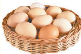
ЯЙЦО, 1 ДЕСЯТОК