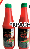
КЕТЧУП "КРАСНОДАРОЧКА" ЧИЛИ, ШАШЛЫЧНЫЙ, 900 ГР