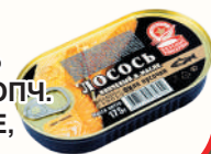
ЛОСОСЬ ФИЛЕ КОПЧ. В МАСЛЕ, 175 ГР