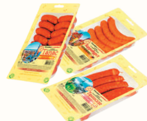
КОЛБАСКИ "ИНЕЙ": "ТАПАС" В/К, 280 ГР; "КАРРИВУРСТ" В/К, 280 ГР; "ТИРОЛЬСКИЕ" В/К, 250 ГР