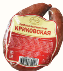
КОЛБАСА "КРИКОВСКАЯ" П/К, АНКОМ, 300 ГР