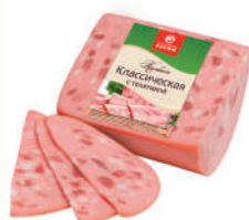
КОЛБАСА "КЛАССИЧЕСКАЯ С ТЕЛЯТИНОЙ" ВАР., ВНМД, 400 ГР