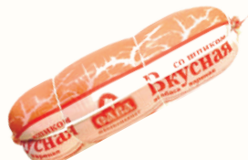
КОЛБАСА "ВКУСНАЯ СО ШПИКОМ" ВАР., САВА, 1 КГ