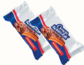
ПЕЧЕНЬЕ-СЭНДВИЧ "СУПЕР-КОНТИК" ШОКОЛАДНЫЙ ВКУС, 100 ГР