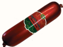
КОЛБАСА "МУСУЛЬМАНСКАЯ" П/К, СОВАД, 350 ГР