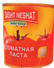
ТОМАТНАЯ ПАСТА, 820 ГР