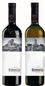
ВИНО "КИММЕРИЯ" В АССОРТИМЕНТЕ, 075 Л