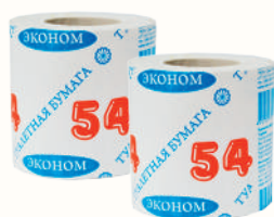
ТУАЛЕТНАЯ БУМАГА С ТИСНЕНИЕМ, 1 РУЛОН