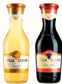
ВИНО "ВИЛЛА ГРАНДЕ" В АССОРТИМЕНТЕ, 1 Л