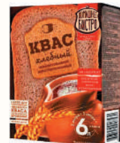
НАБОР ДЛЯ ПРИГОТОВЛЕНИЯ 6 ЛИТРОВ КВАСА "ДОМАШНЕЕ БИСТРО", 124 ГР