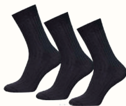
НОСКИ МУЖСКИЕ, В АССОРТИМЕНТЕ, 1 ПАРА