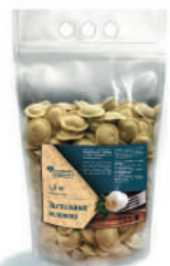
ПЕЛЬМЕНИ "ЗАСТОЛЬНЫЕ" КАТ. В, 1500 ГР