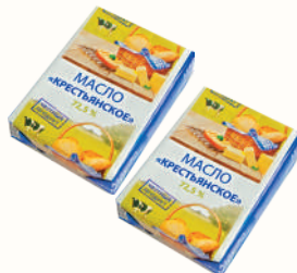
МАСЛО "КРЕСТЬЯНСКОЕ" РАСТИТЕЛЬНО-СЛИВОЧНОЕ 72,5%, 180 ГР