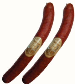
КОЛБАСА "ОДЕССКАЯ ПО-ОСОБОМУ" В/К, СОВАД, 200 ГР