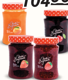
ВАРЕНЬЕ "ДЛЯ ВНУЧАТ" В АССОРТИМЕНТЕ, 340 ГР