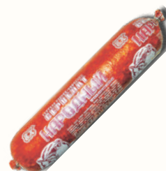
СЕРВЕЛАТ "НАРОДНЫЙ" ЕВРОКОМ, В/К, 1 КГ