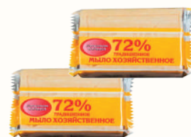
МЫЛО ХОЗЯЙСТВЕННОЕ "МЕРИДИАН", 150 ГР

Ждём Вас с 08:00 до 02:00 по адресам: Санкт-Петербург, м. "Ладожская", пр. Косыгина, 21, м. "Пр. Просвещения", ул. Хошимина, 14