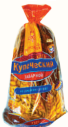
ХЛЕБ "ПЕТРОХЛЕБ" КУПЕЧЕСКИЙ ЗАВАРНОЙ НА РЖАНОМ СОЛОДЕ, "ВОЛХОВХЛЕБ", 500 ГР