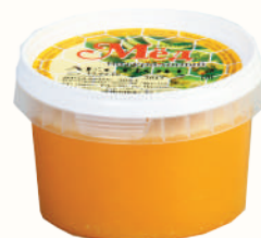
МЕД НАТУРАЛЬНЫЙ "ЛЕСНОЙ", 300 ГР