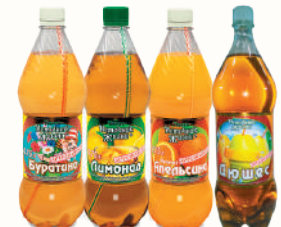
НАПИТОК "ИСТОЧНИК ЖИЗНИ" Б/А ГАЗ. В АССОРТИМЕНТЕ, 750 МЛ