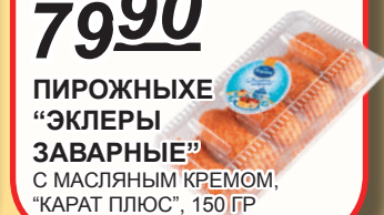
ПИРОЖНЫЕ "ЭКЛЕРЫ ЗАВАРНЫЕ" С МАСЛЯНЫМ КРЕМОМ, "КАРАТ ПЛЮС", 150 ГР