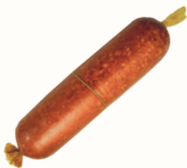
КОЛБАСА "ЗАКУСОЧНАЯ" В/К, ЕВРОКОМ, 1 КГ