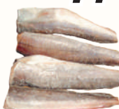
ТУШКА ХЕКА С/М, 1 КГ