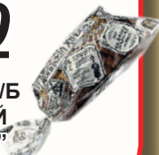
ИЗДЕЛИЕ Х/Б "ДВИНСКИЙ ЗАВАРНОЙ" НАРЕЗ., "ДАРНИЦА", 350 ГР