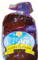
ХЛЕБ "МОНАСТЫРСКИЙ" "ВОЛХОВХЛЕБ", 300 ГР