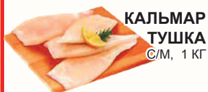
КАЛЬМАР ТУШКА С/М, 1 КГ