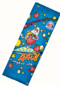
МОРОЖЕНОЕ СЛАДКИЙ ЛЕД "ДАЙ" КЛУБНИКА-ЛАЙМ, 70 ГР