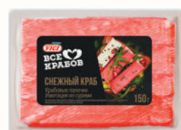
КРАБОВОЕ ПАЛОЧКИ "СНЕЖНЫЙ КРАБ" "ВИЧИ" ОХЛ., 150 ГР