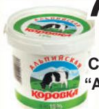
ПРОДУКТ СМЕТАННЫЙ "АЛЬПИЙСКАЯ КОРОВКА" 15%, 900 ГР