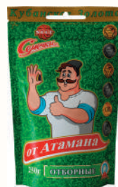
СЕМЕЧКИ "ОТ АТАМАНА" ОТБОРНЫЕ, 250 ГР