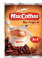
НАПИТОК КОФЕЙНЫЙ "МАККОФЕ" 3 В 1, ОРИГИНАЛ РАСТ., 10 ПАК. X 20 ГР