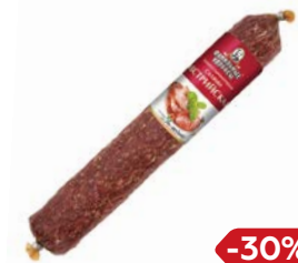
Салями АВСТРИЙСКАЯ , Сырокопченая, Пре- миум, мини (Фамиль- ные колбасы), 100 г