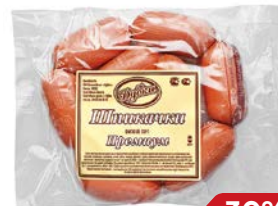
Шпикачки ПРЕМИУМ , Выс- ший сорт (Дубки), 500 г