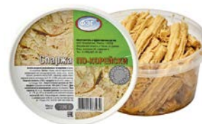
Спаржа ПО-КОРЕЙСКИ (ФерЭльгам), 300 г