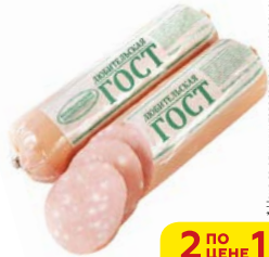
Колбаса ЛЮБИТЕЛЬСКАЯ , ГОСТ, вареная (Великолукский МК), 500 г