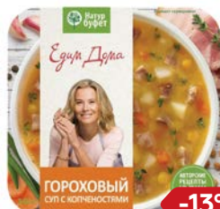
Готовый обед НАТУРБУФЕТ Суп гороховый с колбасостями, 340 г