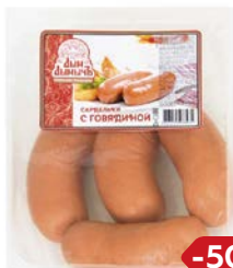
Сардельки С ГОВЯДИНОЙ , Мини (Агротэк), 100 г