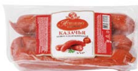
Колбаса КАЗАЧЬЯ , полукопченая (МПК Атяшевский), 400 г