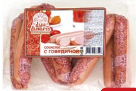
Сосиски ДЫМ ДЫМЫЧЬ , С говядиной (Агротэк), 400 г