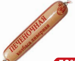
Колбаса ПЕЧЕНОЧНАЯ , ливерная, мини (МПК Атяшев- ский), 250 г