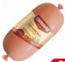
Ветчина ФЕРМЕРСКАЯ , (Стародворские колбасы), 400 г

* Цена за единицу товара при одновременной покупке 2 одинаковых акционных товаров