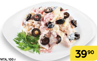
Салат МАРГАРИТА , 100 г