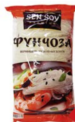
Вермишель СЕН СОЙ , Фунчоза, 200 г