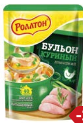
Бульон РОЛЛТОН , куриный, 100 г