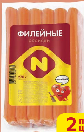
Сосиски ФИЛЕЙНЫЕ, Из мяса птицы, вареные (ОМПК), 270 г