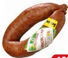
Колбаса КРАКОВСКАЯ, Полукопченая, ГОСТ (Велком), 450 г