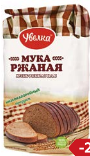
Мука УВЕЛКА ржаная, 1,9 кг