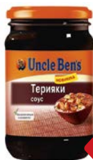
Соус АНКЛ БЕНС , Терияки, 210 г