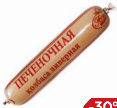
Колбаса ПЕЧЕНОЧНАЯ, ливерная, мини (МПК Атяшевский), 250 г