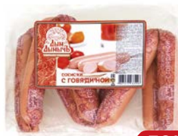
Сосиски ДЫМ ДЫМЫЧ, С говядиной (Агротэк), 400 г