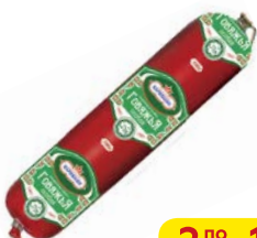
Колбаса ГОВЯЖЬЯ ОСОБАЯ, Халаль, полукопченая, мини (Царицыно), 500 г

* Цена за единицу товара при одновременной покупке 2 одинаковых акционных товаров