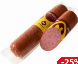
Сервелат КРЕМЛЕВСКИЙ, (ОМПК), 100 г