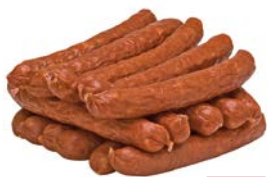
Колбаски ОХОТНИЧЬИ, Полукопченые (Первый Одинцовский МК), 100 г