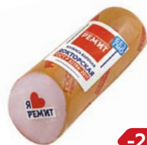
Колбаса ДОКТОРСКАЯ, (Ремит), 500 г

* Цена за единицу товара при одновременной покупке 2 одинаковых акционных товаров