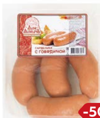
Сардельки С ГОВЯДИНОЙ, Мини (Агротэк), 100 г