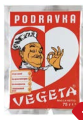
Приправа универ- сальная ВЕГЕТА , 75 г