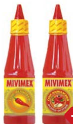
Соус МИВИМЕК , Кавказский, чили/ Перцовый, 200 г