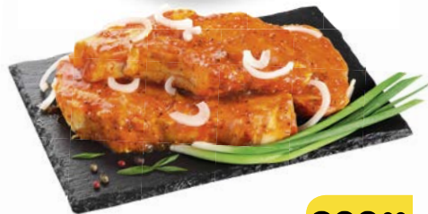
Полуфабрикат шашлык «ТОРРЕС» , в маринаде «Горчично-сладкий», 1 кг