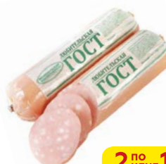
Колбаса ЛЮБИТЕЛЬСКАЯ, ГОСТ, вареная (Великолукский МК), 500 г