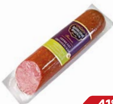
Сервелат ЕВРОПЕЙСКИЙ, Заповедные продукты, Варено-копченый (Дмитровские колбасы), 400 г

* Цена за единицу товара при одновременной покупке 2 одинаковых акционных товаров