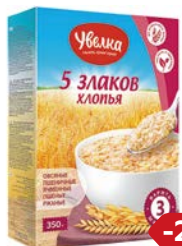
Хлопья УВЕЛКА , 5 злаков, 350г