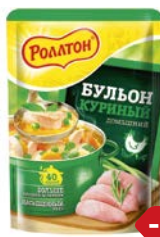
Бульон РОЛЛТОН , куриный, 100г