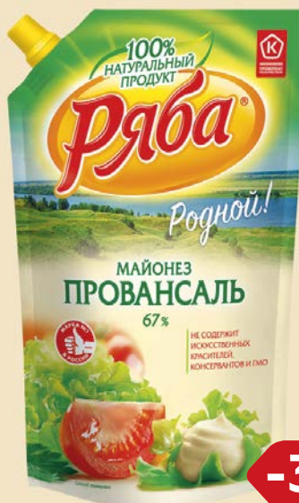
Майонез РЯБА , Провансаль, 67%, 744г