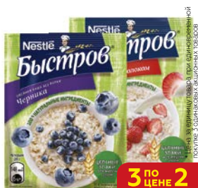
Каша БЫСТРОВ черника/ клубника с молоком, 40г