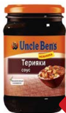
Соус АНКЛ БЕНС , Терияки, 210г