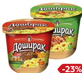
Пюре картофель- ное ДОШИРАК , Со вкусом: Курицы/ Мяса, 40г