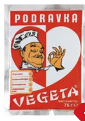
Приправа универ- сальная ВЕГЕТА , 75г