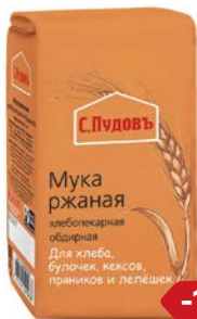
Мука С.Пудовъ ржаная, 1кг