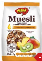
Мюсли ОГО , С тропическими фруктами, 350г