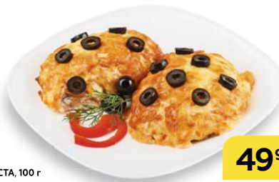
Свинина ФИЕСТА , 100 г