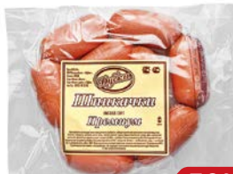
Шликачки ПРЕМИУМ , Высший сорт (Дубки), 500 г