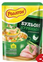
Бульон РОЛЛТОН, куриный, 100 г