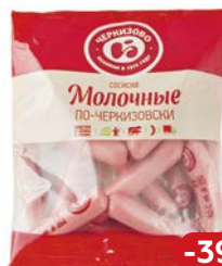
Сосиски МОЛОЧНЫЕ , По-черкизовски (ЧМПЗ), 650 г