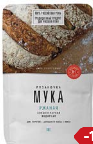
Мука ржаная РЯЗАНОЧКА, 1 кг