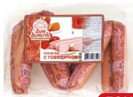
Сосиски ДЫМ ДЫМЫЧЬ , С говядиной (Агротэк), 400 г