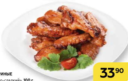
КРЫЛЬЯ КУРИНЫЕ в соусе «Кисло-сладкий», 100 г