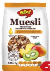
Мюсли ОГО, С тропическими фруктами, 350 г