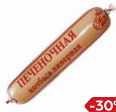
Колбаса ПЕЧЕНОЧНАЯ , ливерная, мини (МПК Атяшевский), 250 г