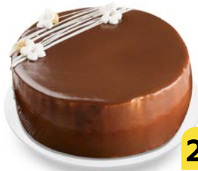
Торт бисквитный ШОГАНА , 850 г