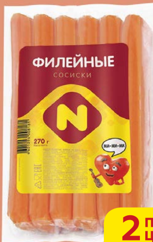
Сосиски ФИЛЕЙНЫЕ , Из мяса птицы, вареные (ОМПК), 270 г

* Цена за единицу товара при одновременной покупке 2 одинаковых акционных товаров