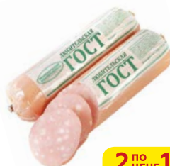
Колбаса ЛЮБИТЕЛЬСКАЯ , ГОСТ, вареная (Великолукский МК), 500 г