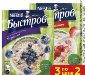
Каша БЫСТРОВ черника/ клубника с молоком, 40 г