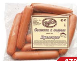
Сосиски ПРЕМИУМ , с сыром, мини (Дубки), 100 г