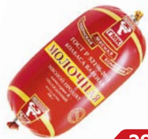
Колбаса МОЛОЧНАЯ , вареная, ГОСТ (Губкинский МК), 500 г