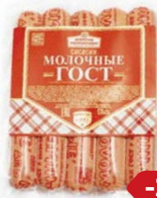
Сосиски МОЛОЧНЫЕ ГОСТ высший сорт (Брянский МК), 100 г