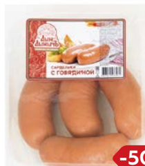
Сардельки с ГОВЯДИНОЙ , Мини (Агротэк), 100 г