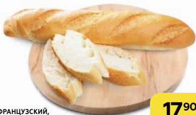
Мини-багет ФРАНЦУЗСКИЙ , 130 г