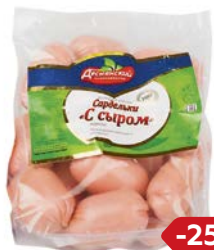
Сардельки с СЫРОМ (Деснянский), 100 г

* Цена за единицу товара при одновременной покупке 2 одинаковых акционных товаров