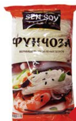
Вермишель СЕН СОЙ, Фунчоза, 200 г