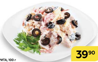
Салат МАРГАРИТА , 100 г