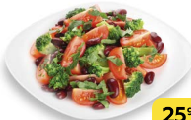
Салат МАНХЭТТЕН , 100 г