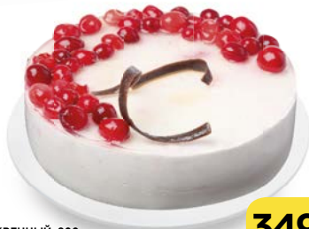
Торт бисквитный ЧИЗКЕЙК КЛЮКВЕННЫЙ , 800 г