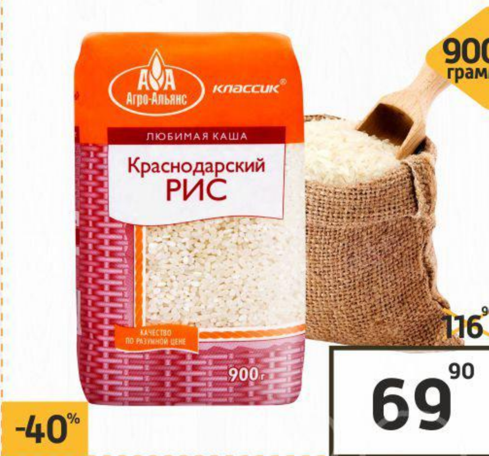
РИС «КРАСНОДАРСКИЙ» Классик 900г АГРО-АЛЬЯНС