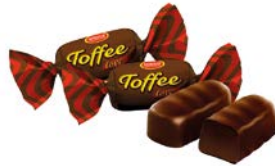
Ирис ТОФФИ ЛАВ, Лав, шоколадный, глазированный, 100г