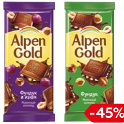
Шоколад АЛЬПЕН ГОЛЬД, В ассортименте***, 90г