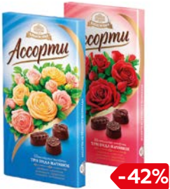
Набор конфет БАБАЕВСКИЙ, Ассорти, 300г