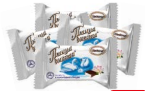
Конфеты ПТИЦА ДИВНАЯ, 100г