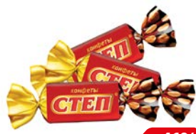
Конфеты ЗОЛОТОЙ СТЕП, Арахис-фундук-карамель (Славянка), 100г