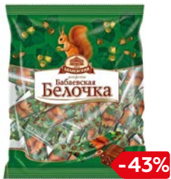
Конфеты БЕЛОЧКА (Бабаевский), 200г