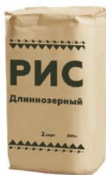
РИС длиннозерный, 800 г