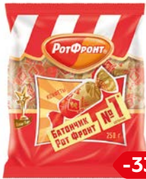
Конфеты БАТОНЧИКИ (Рот Фронт), 250г