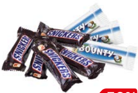
Конфеты СНИКЕРС/БАУНТИ, Минис, 100г