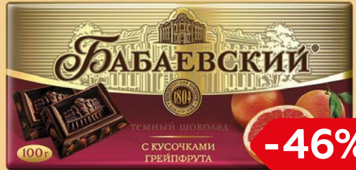
Шоколад БАБАЕВСКИЙ в ассортименте***, 100г