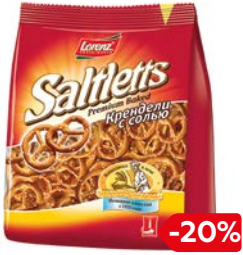
Крендель СОЛТЛЕТС, с солью (Лоренц), 150г