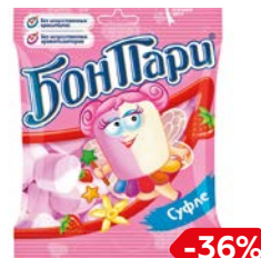
Суфле БОН ПАРИ, 90г