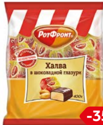
Конфеты ХАЛВА В шоколадной глазури (Рот Фронт), 400г