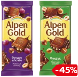
Шоколад АЛЬПЕН ГОЛЬД, В ассортименте***, 90 г