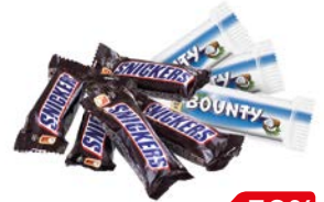
Конфеты СНИКЕРС/БАУНТИ, Минис, 100 г