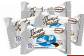
Конфеты ПТИЦА ДИВНАЯ, 100 г