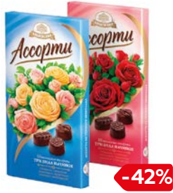
Набор конфет БАБАЕВСКИЙ, Ассорти, 300 г