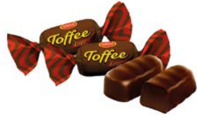
Ирис ТОФФИ ЛАВ, Лав, шоколадный, глазированный, 100 г