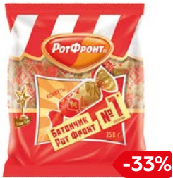
Конфеты БАТОНЧИКИ (Рот Фронт), 250 г