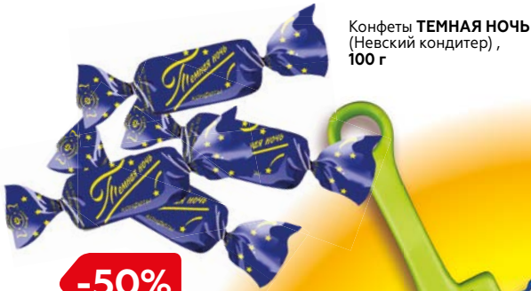
Конфеты ТЕМНАЯ НОЧЬ (Невский кондитер), 100 г