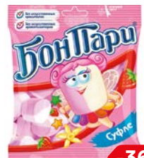
Суфле БОН ПАРИ, 90 г