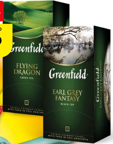
Чай ГРИНФИЛД , в ассортименте**, 25 пакетиков