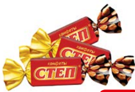
Конфеты ЗОЛОТОЙ СТЕП, Арахис-фундук-карамель (Славянка), 100 г