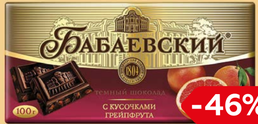
Шоколад БАБАЕВСКИЙ в ассортименте***, 100 г