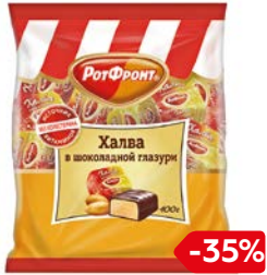
Конфеты ХАЛВА В шоколадной глазури (Рот Фронт), 400 г