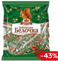
Конфеты БЕЛОЧКА (Бабаевский), 200 г