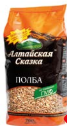
Крупа, полба АЛТАЙСКАЯ СКАЗКА, Шлифо- ванная, 700 г