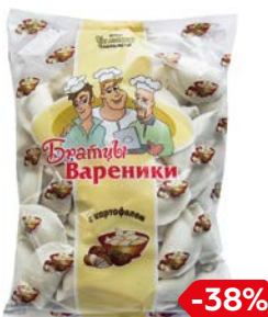
Вареники БРАТЦЫ, С картошкой (Уральские Пельмени), 900 г

* Цена за единицу товара при одновременной покупке 2 одинаковых акционных товаров