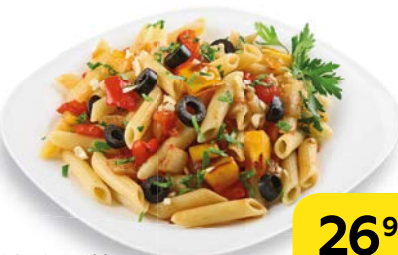
ПАСТА С ОВОЩАМИ , 100 г