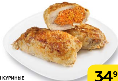
РУЛЕТКИ КУРИНЫЕ с пикантной начинкой, 100 г