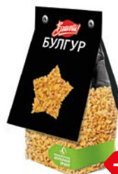
Булгур БРАВОЛЛИ , 350 г