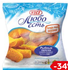
Палочки рыбные ВИЧИ, 500 г