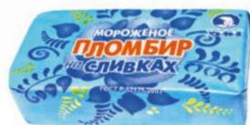
Мороженое ЧЕЛНЫЙ ХОЛОД, Пломбир на сливках, 200 г