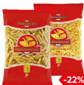
Макаронные изде- лия ШЕБЕКИНСКИЕ , В ассортименте***, 450 г