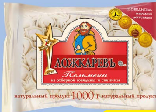
Пельмени ЛОЖКАРЕВЪ, Из отборной говядины-свинины (Шельф), 1 кг