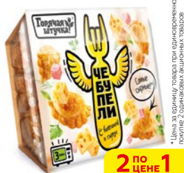
Чебурепели ГОРЯЧАЯ ШТУЧКА, С ветчиной и сыром, 300 г