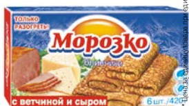
Блины МОРОЗКО, с ветчиной и сыром, 420 г