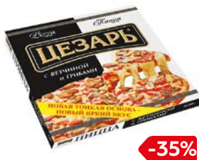
Пицца ЦЕЗАРЬ, С ветчиной и грибами (Морозко), 420 г