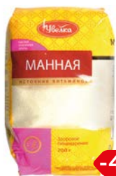
Крупа манная УВЕЛКА , 700 г