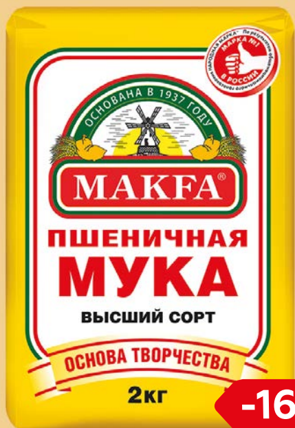
Мука пшеничная МАКФА® высший сорт, 2 кг