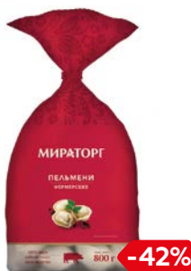
Пельмени МИРАТОРГ, Фермерские, 800 г