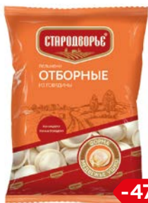
Пельмени СТАРОДВОРЬЕ, Отборные, говяжьи, 900 г