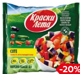
Соте КРАСКИ ЛЕТА, замороженное, 400 г