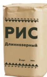
РИС длиннозерный, 800 г