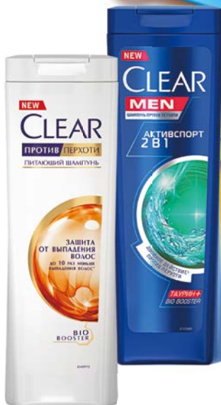
Шампунь CLEAR® в ассортименте***, 400 мл