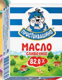
Масло сливочное ПРОСТОКВАШИНО 82%, 180 г