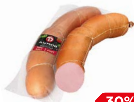
Колбаса ДОКТОРСКАЯ, ГОСТ (Дымов), 100 г