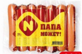
Сосиски ПАПА МОЖЕТ (ОМПК), 350 г