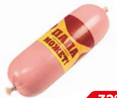
Колбаса ПАПА МОЖЕТ, Вареная (ОМПК), 500 г

* Цена за единицу товара при одновременной покупке 2 одинаковых акционных товаров