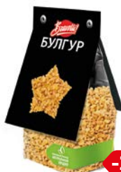
Булгур БРАВОЛЛИ , 350 г