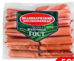
Сосиски МОЛОЧНЫЕ, ГОСТ (Великолуksкий МК), 650 г