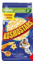
Завтрак готовый КОСМОСТАРС , Звездочки и Галак- тики медовые, 450 г