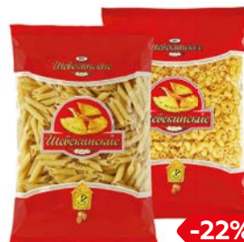
Макаронные изде- лия ШЕБЕКИНСКИЕ , В ассортименте***, 450 г