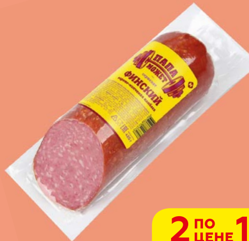
Сервелат ФИНСКИЙ, Папа Может, варено-копченый (ОМПК), 420 г