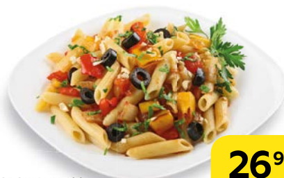
ПАСТА С ОВОЩАМИ , 100 г