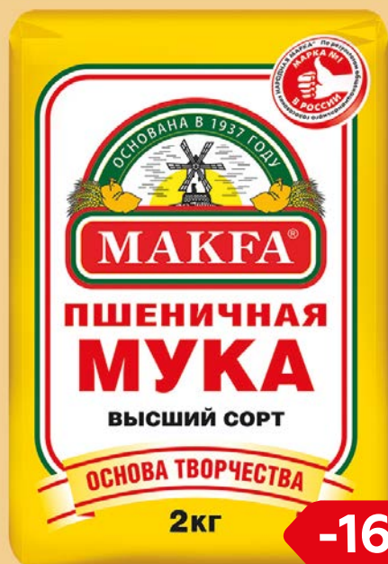
Мука пшеничная МАКФА® высший сорт, 2 кг