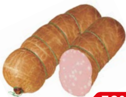
Колбаса РОССИЙСКАЯ, Традиционная вареная (Иней), 100 г

* Цена за единицу товара при одновременной покупке 2 одинаковых акционных товаров