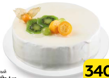
Торт бисквитный «ТВОРОЖНЫЙ», 1 кг