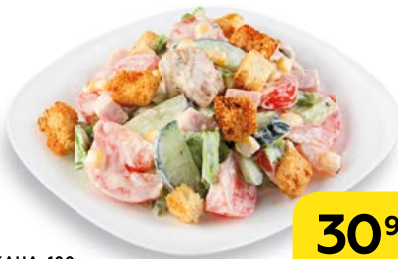
Салат ТОСКАНА , 100 г