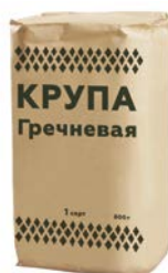
Крупа ГРЕЧНЕВАЯ, 800 г