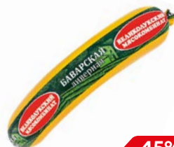
Колбаса БАВАРСКАЯ, ливерная (Велико- луksкий МК), 330 г

* Цена за единицу товара при одновременной покупке 2 одинаковых акционных товаров