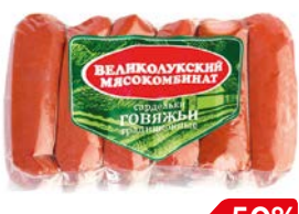
Сардельки ГОВЯЖЬИ, Традиционные, (Великолуksкий МК), 600 г