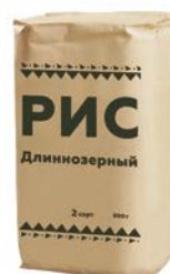
РИС длиннозерный, 800 г