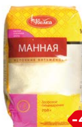
Крупа манная УВЕЛКА , 700 г