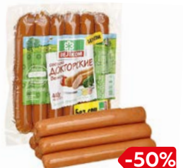
Сосиски ДОКТОРСКИЕ (Велком), 440 г