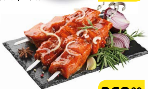
Полуфабрикат ШАШЛЫК ИЗ СВИНИНЫ в маринаде «Ткемали» из лопатки, 1 кг