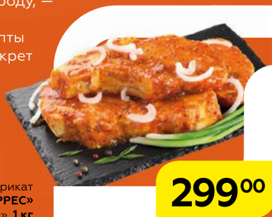
Полуфабрикат ШАШЛЫК «ТОРРЕС» в маринаде «Горчично-сладкий», 1 кг

Семья магазинов «Магнит». Давайте дружить семьями!