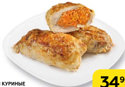
РУЛЕТКИ КУРИНЫЕ с пикантной начинкой, 100 г