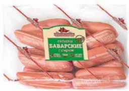
Сосиски БАВАРСКИЕ, с сыром (Невская Трапеза), 100 г