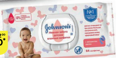
Салфетки влажные JOHNSON'S®, Нежная забота, 64 шт.