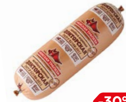
Колбаса ДОКТОРСКАЯ, ГОСТ (Невская Трапеза), 100 г