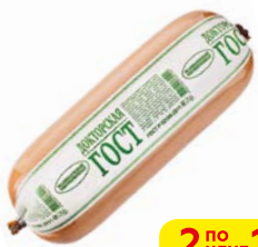
Колбаса ДОКТОРСКАЯ, ГОСТ (Велико- луksкий МК), 500 г