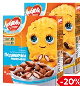
Подушечки ЛЮБЯТОВО с начинкой: молоч- ной/ шоколадной, 250 г