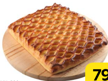
ПИРОГ С ЯБЛОКАМИ, 500 г