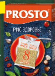
РИС «ЗДОРОВЬЕ» Prosto, в/пак., 8 x 62,5 г, 500 г