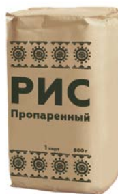
РИС Пропаренный, 1-й сорт, 800 г