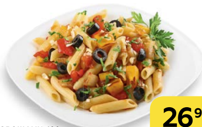
ПАСТА С ОВОЩАМИ , 100 г