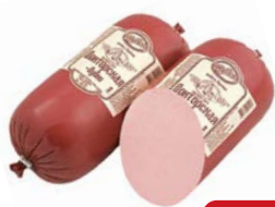
Колбаса ДОКТОРСКАЯ Вареная (Дубки), 500 г