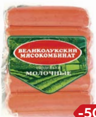
Сардельки МОЛОЧНЫЕ (Великолукский МК), 500 г