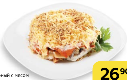
САЛАТ слоеный с мясом копченой курицы, 100 г