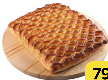
ПИРОГ С ЯБЛОКАМИ, 500 г