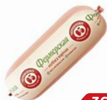
Колбаса ФЕРМЕРСКАЯ, Вареная (ЧМПЗ), 500 г