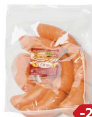
САРДЕЛЬКИ С ПЕРЧИКОМ (Жупиков), 100 г