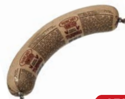
Колбаса ТРАДИЦИОННАЯ ливерная (Микоян), 400 г