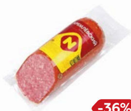
Сервелат КРЕМЛЕВСКИЙ, Варено-копченый (ОМПК), 420 г