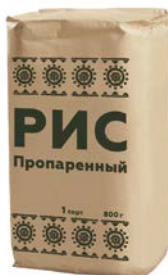
РИС Пропаренный, 1-й сорт, 800 г