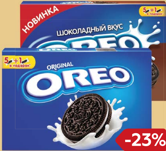
Печенье OREO, С какао и шоколадной начинкой/ Классическое, 228 г