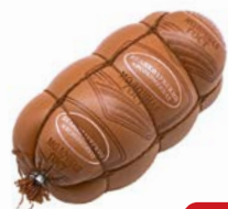
Колбаса МОЛОЧНАЯ, ГОСТ, вареная (Великолукский МК), 500 г