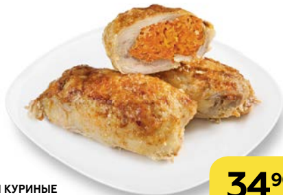
РУЛЕТКИ КУРИНЫЕ с пикантной начинкой, 100 г