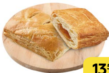
СЛОЙКА с яблочной начинкой, 60 г