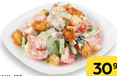
Салат ТОСКАНА , 100 г