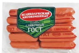
Сосиски СЛИВОЧНЫЕ, ГОСТ (Велико- лукский МК), 650 г