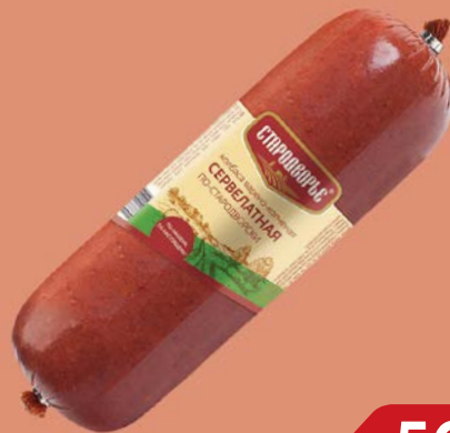
Колбаса сервелатная ПО-СТАРОДВОРСКИ, Варено-копченая (Стародворские колбасы), 700 г