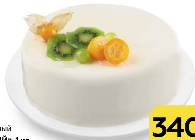
Торт бисквитный «ТВОРОЖНЫЙ», 1 кг