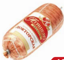
Колбаса ДОКТОРСКАЯ, вареная, премиум (МПК Атяшевский), 500 г