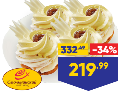
ПИРОЖНЫЕ СМОЛЬНИНСКИЙ ХЛЕБОЗАВОД МАНГОВЫЕ, бисквитные, 75 г x 4 шт. в уп.

*подробные правила и условия акции на сайте promo.lenta.com