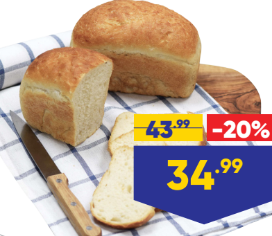
ХЛЕБ ФЕРМЕРСКИЙ, на сыворотке, 190 г