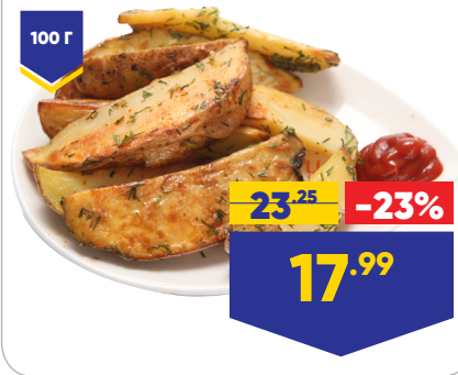
КАРТОФЕЛЬ АЙДАХО, весовой