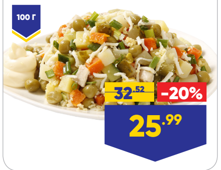
САЛАТ СТОЛИЧНЫЙ, весовой