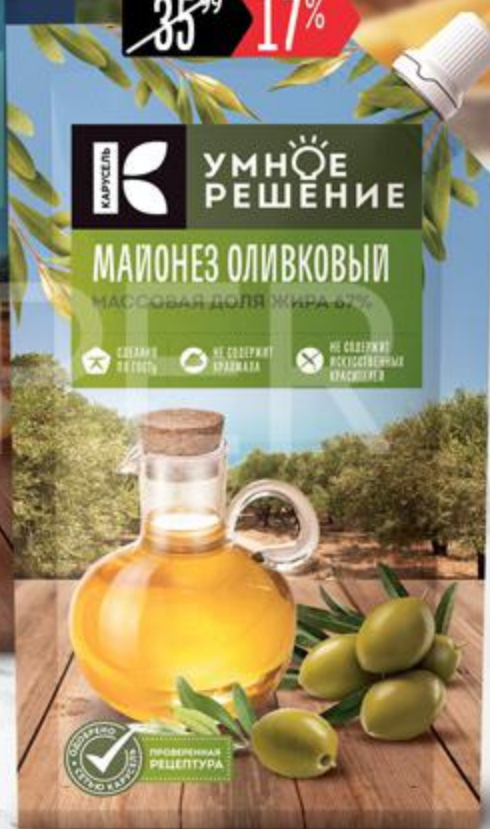
Майонез УМНОЕ РЕШЕНИЕ Оливковый 67%, 230 мл