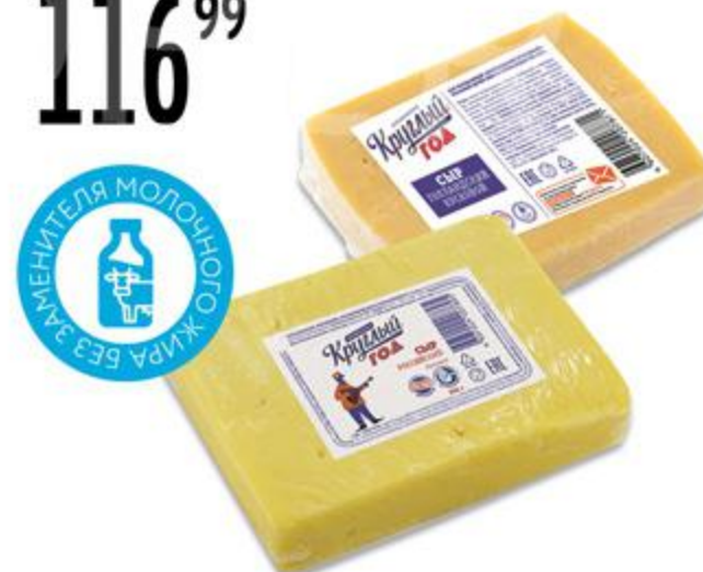
Сыр КРУГЛЫЙ ГОД Российский 50%/ Голландский 45%, 250 г