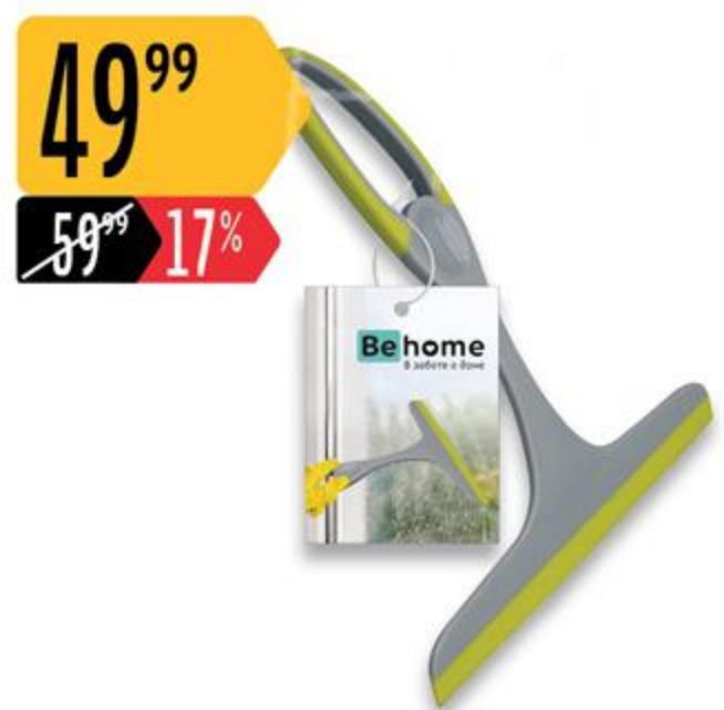
Водосгон ВЕНОМЕ для стекол