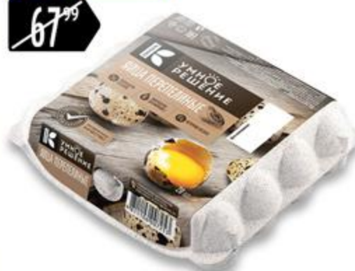
Яйца УМНОЕ РЕШЕНИЕ Молодецкие перепелиные, 20 шт.