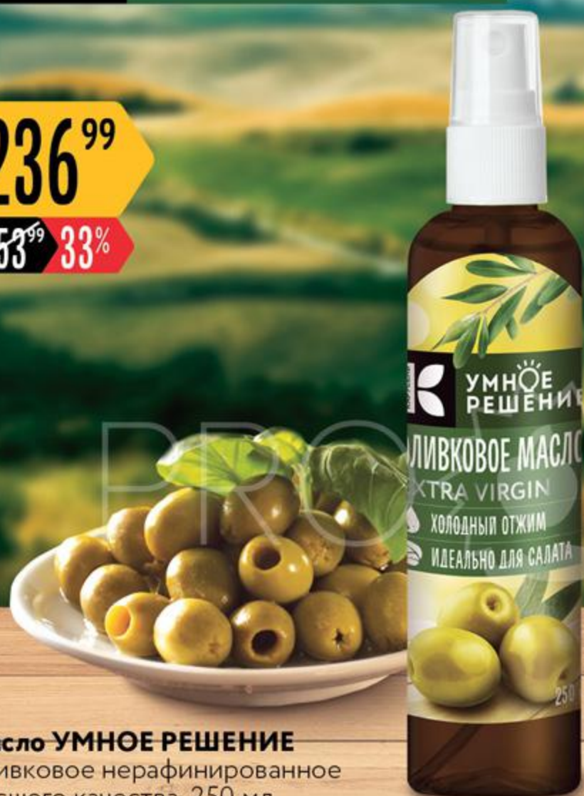
Масло УМНОЕ РЕШЕНИЕ оливковое нерафинированное высшего качества, 250 мл