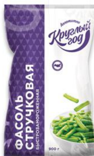
Фасоль КРУГЛЫЙ ГОД стручковая резанная замороженная, 900 г