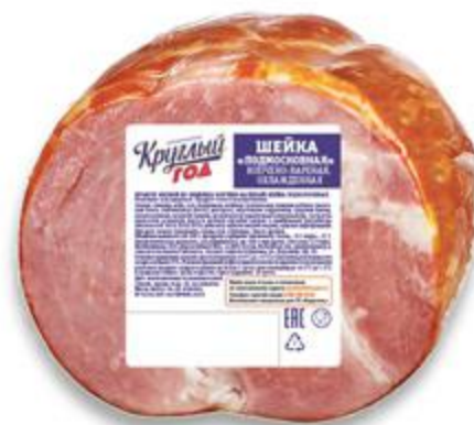
Шейка КРУГЛЫЙ ГОД Подмосковная, 100 г