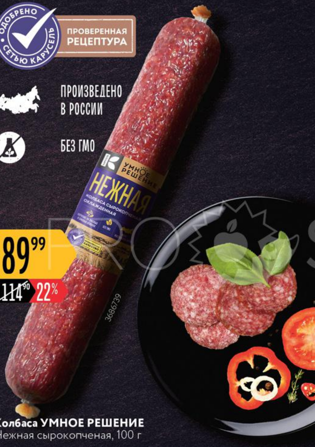
Колбаса УМНОЕ РЕШЕНИЕ Нежная сырокопченая, 100 г