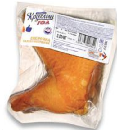
Окорочка КРУГЛЫЙ ГОД куриные Любительские, варено-копченые, 100 г