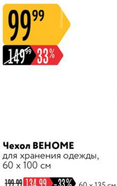
Чехол ВЕНОМЕ для хранения одежды, 60 x 100 см