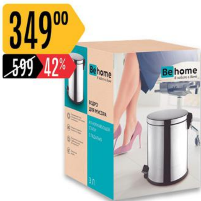
Ведро ВЕНОМЕ для мусора, с педалью, 3 л