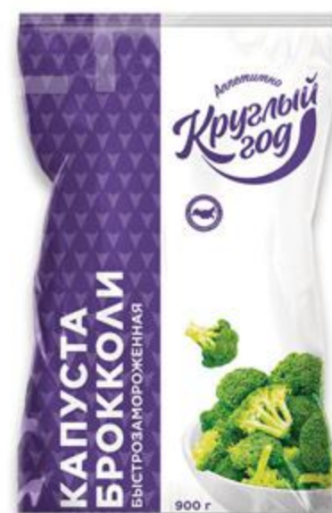
Капуста брокколи КРУГЛЫЙ ГОД замороженная, 900 г