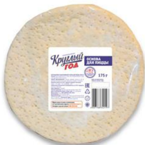
Основа для пиццы КРУГЛЫЙ ГОД замороженная, 175 г