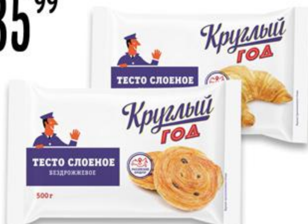
Тесто КРУГЛЫЙ ГОД слоеное дрожжевое/ бездрожжевое замороженное, 500 г