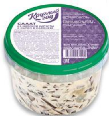
Салат КРУГЛЫЙ ГОД из морской капусты с сыром, 250 г