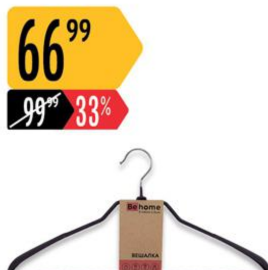
Вешалка ВЕНОМЕ металлическая для верхней одежды