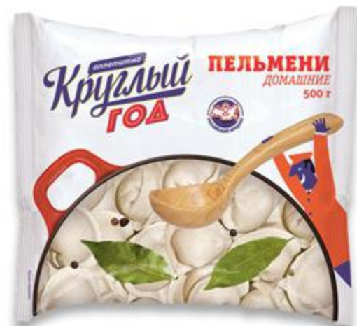
Пельмени КРУГЛЫЙ ГОД Домашние, 500 г