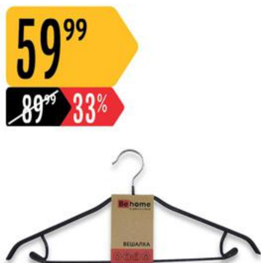
Вешалка ВЕНОМЕ металлическая для одежды