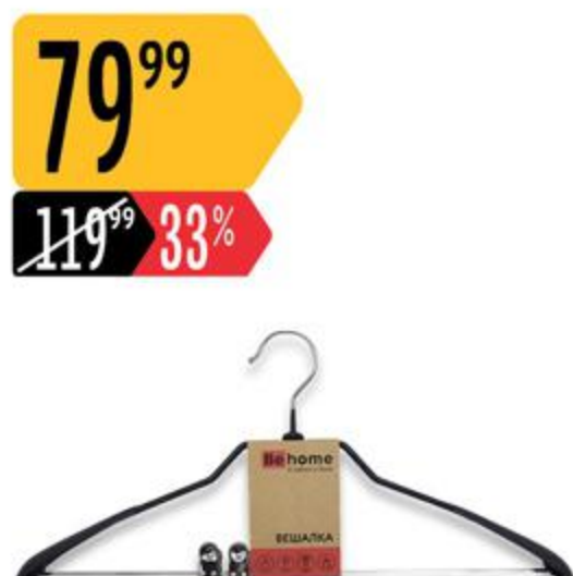
Вешалка ВЕНОМЕ металлическая костюмная с зажимом