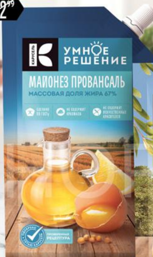
Майонез УМНОЕ РЕШЕНИЕ Провансаль 67%, 230 мл