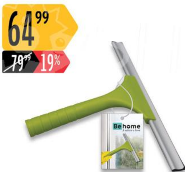
Водосгон ВЕНОМЕ Стеклоочиститель ВЕНОМЕ