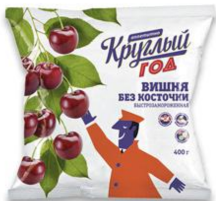
Вишня КРУГЛЫЙ ГОД без косточки, 400 г