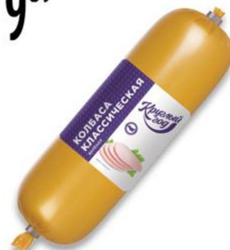
Колбаса КРУГЛЫЙ ГОД вареная, 100 г