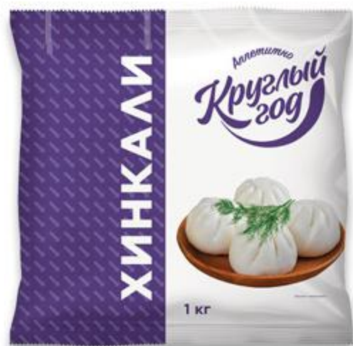
Хинкали КРУГЛЫЙ ГОД замороженные, 1 кг