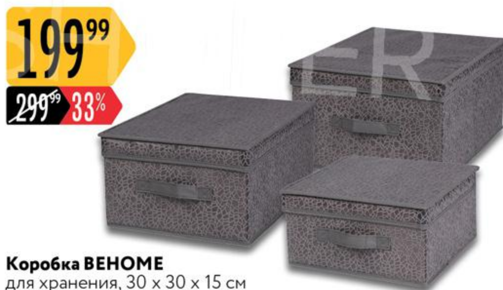
Коробка ВЕНОМЕ для хранения, 30 x 30 x 15 см