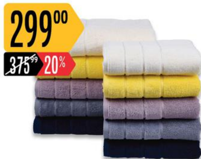
Полотенце ВЕНОМЕ ELEGANT CASA, 50 x 90 см, 100% хлопок, в ассортименте