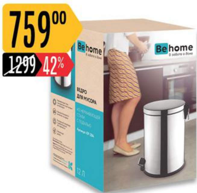
Ведро ВЕНОМЕ для мусора, с педалью, 12 л