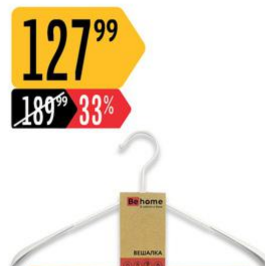
Вешалка ВЕНОМЕ ПРОВАНС белая