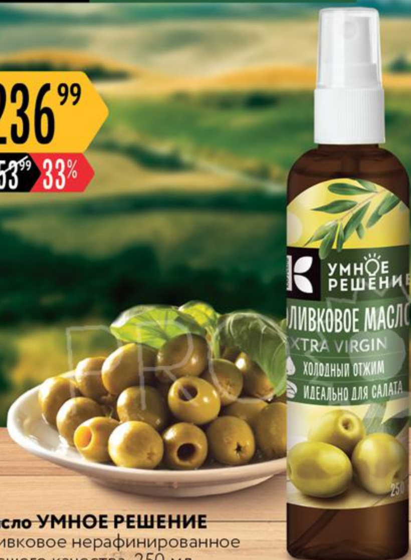
Масло УМНОЕ РЕШЕНИЕ оливковое нерафинированное высшего качества, 250 мл