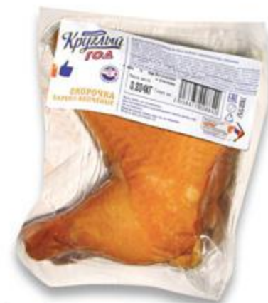
Окорочка КРУГЛЫЙ ГОД куриные Любительские, варено-копченые, 100 г