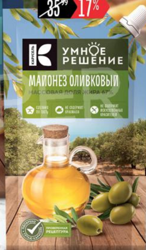
Майонез УМНОЕ РЕШЕНИЕ Оливковый 67%, 230 мл