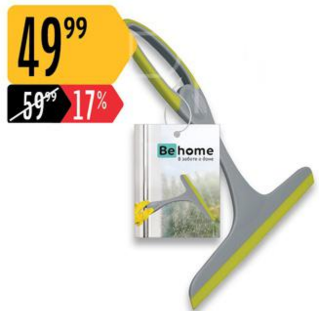
Водосгон ВЕНОМЕ для стекол

3688093, 3688094, 3688095, 3688096, 3688097