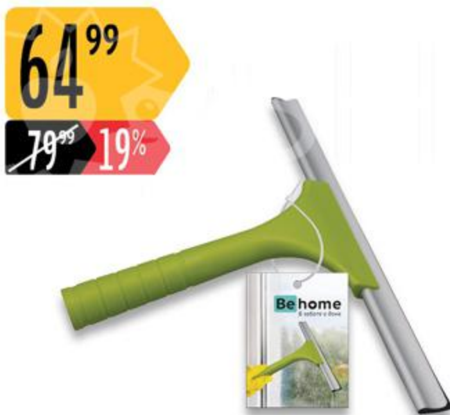
Водосгон ВЕНОМЕ Стеклоочиститель ВЕНОМЕ