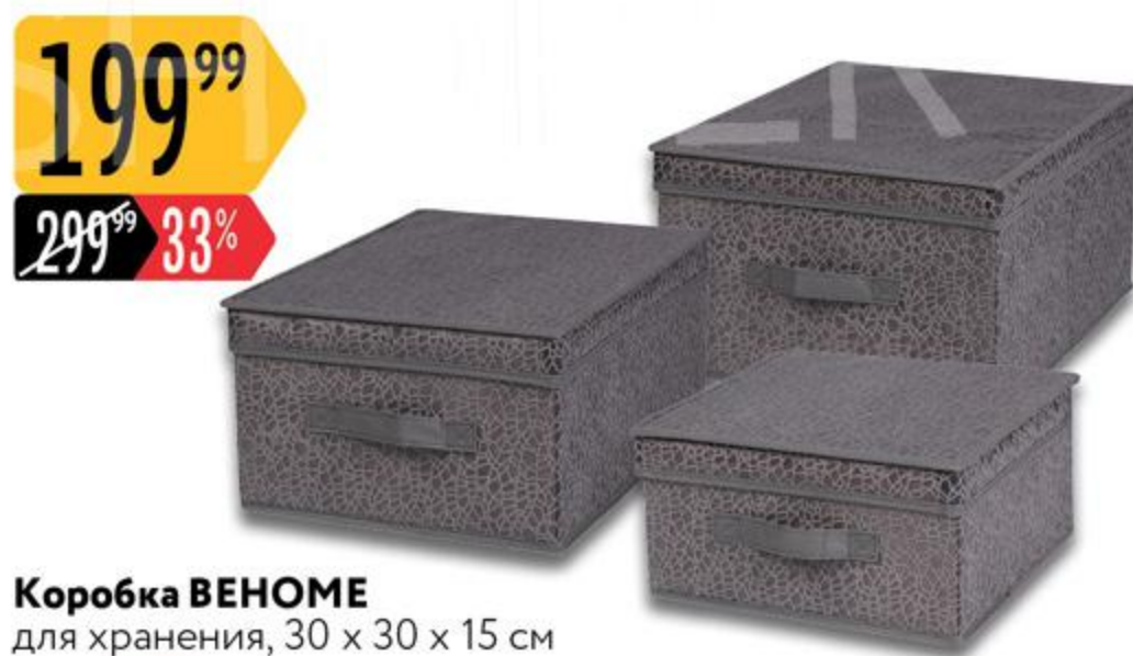
Коробка ВЕНОМЕ для хранения, 30 x 30 x 15 см 349.99 234.99 -33% 30 x 40 x 18 см 399.99 269.99 -33% 30 x 30 x 15 см