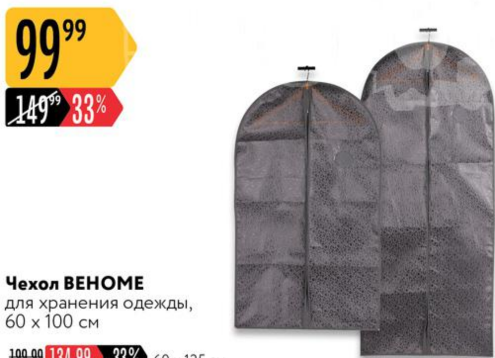
Чехол ВЕНОМЕ для хранения одежды, 60 x 100 см 199.99 134.99 -33% 60 x 135 см