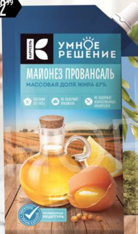
Майонез УМНОЕ РЕШЕНИЕ Провансаль 67%, 230 мл