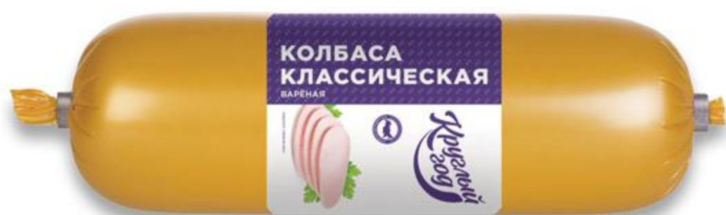
Колбаса КРУГЛЫЙ ГОД вареная, 100 г