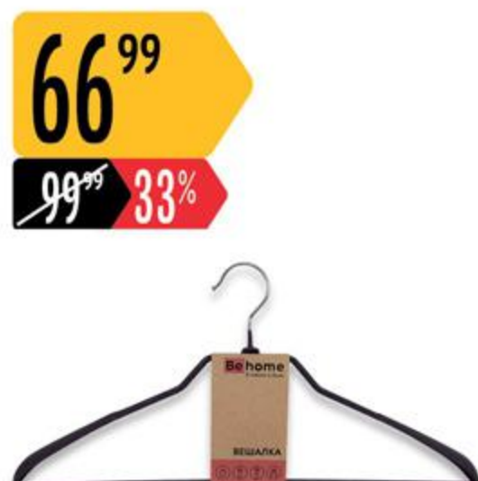
Вешалка ВЕНОМЕ металлическая для верхней одежды