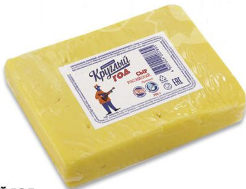
Сыр КРУГЛЫЙ ГОД Российский 50%, 250 г