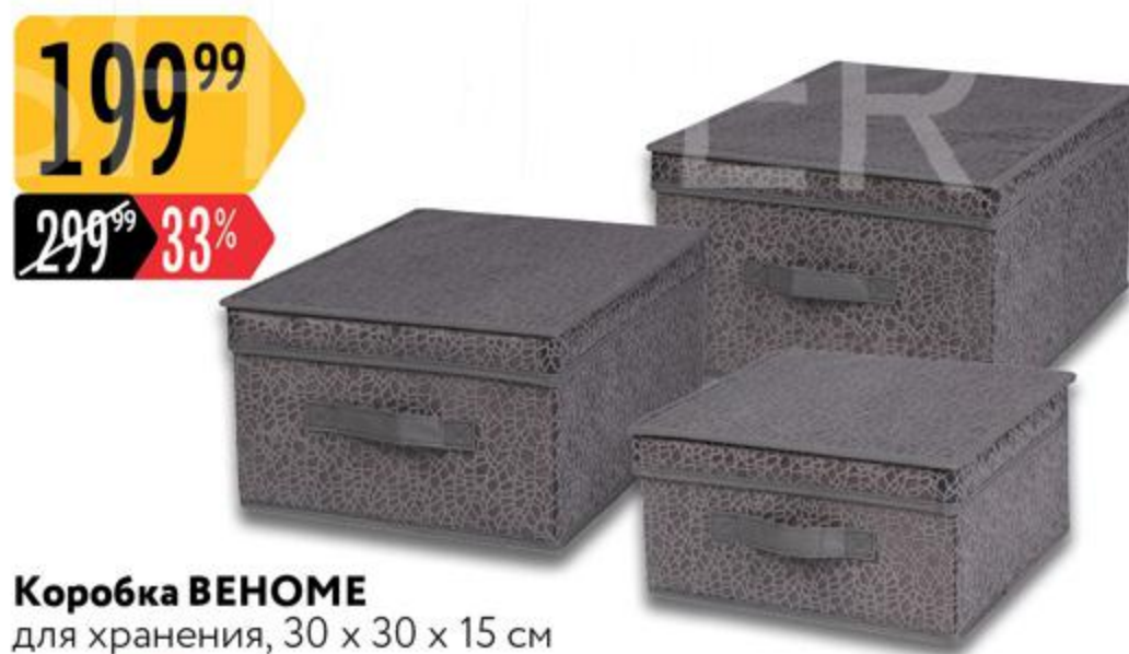
Коробка ВЕНОМЕ для хранения, 30 x 30 x 15 см 349.99 234.99 -33% 30 x 40 x 18 см 399.99 269.99 -33% 30 x 30 x 15 см