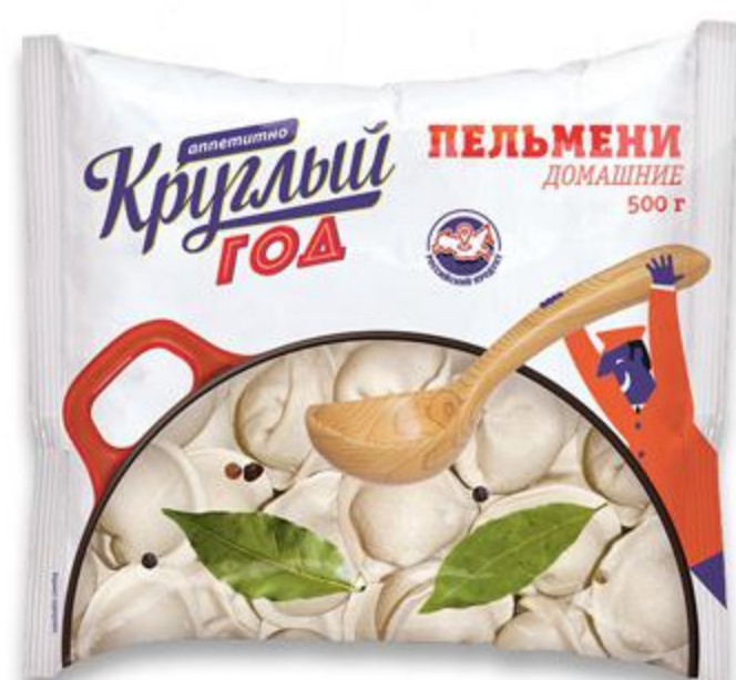
Пельмени КРУГЛЫЙ ГОД Домашние, 500 г