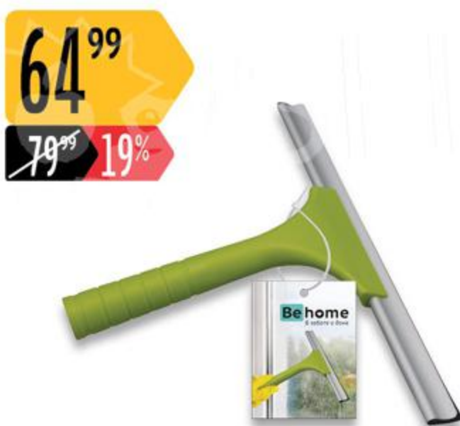
Водосгон ВЕНОМЕ Стеклоочиститель ВЕНОМЕ