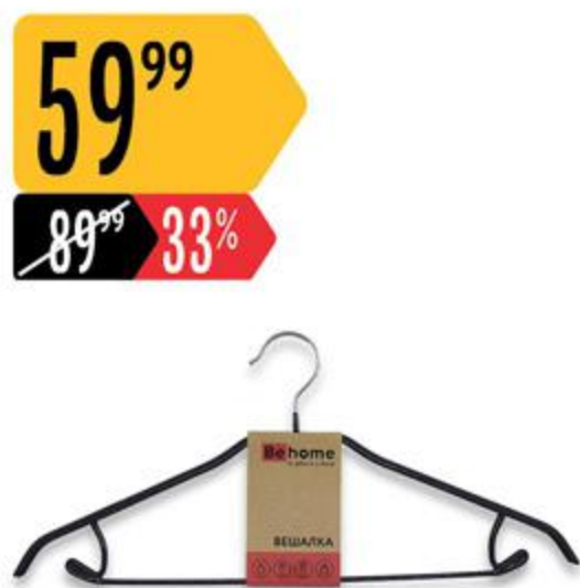
Вешалка ВЕНОМЕ металлическая для одежды