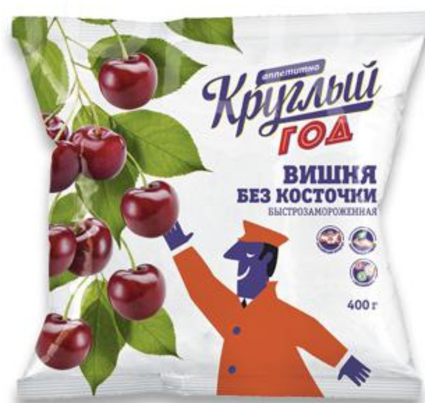
Вишня КРУГЛЫЙ ГОД без косточки, 400 г