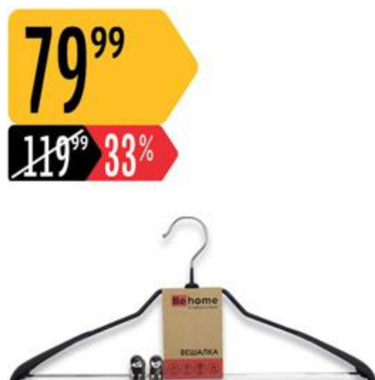
Вешалка ВЕНОМЕ металлическая костюмная с зажимом