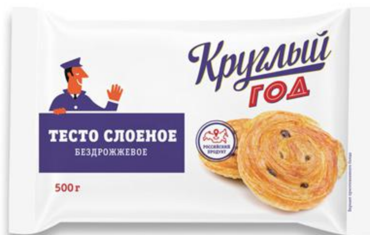
Тесто КРУГЛЫЙ ГОД слоеное бездрожжевое замороженное, 500 г