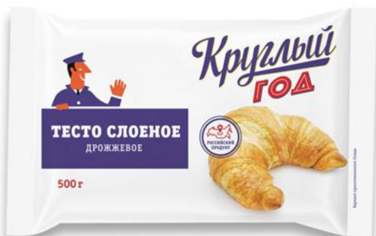
Тесто КРУГЛЫЙ ГОД слоеное дрожжевое замороженное, 500 г