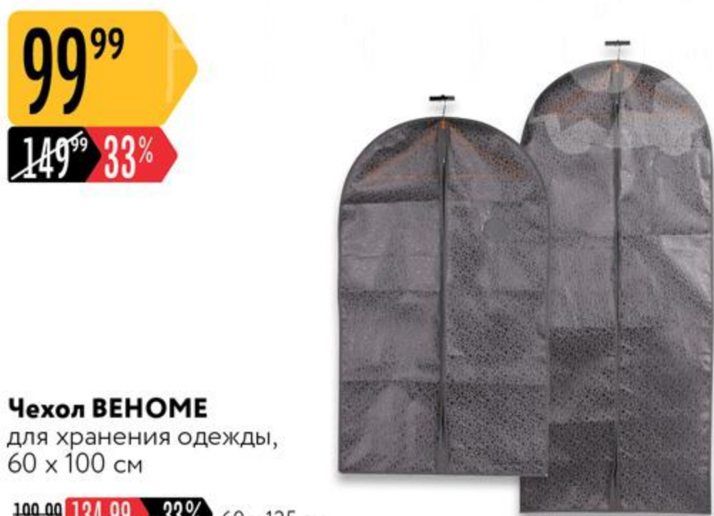
Чехол ВЕНОМЕ для хранения одежды, 60 x 100 см 199.99 134.99 -33% 60 x 135 см