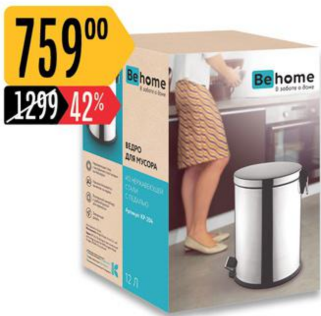
Ведро ВЕНОМЕ для мусора, с педалью, 12 л