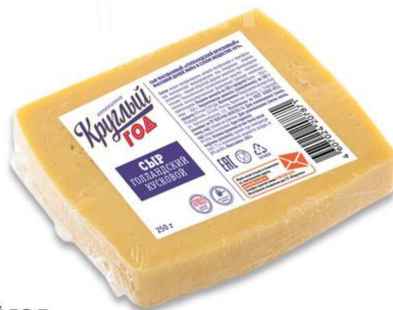
Сыр КРУГЛЫЙ ГОД Голландский 45%, 250 г