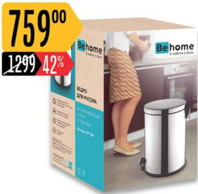
Ведро ВЕНОМЕ для мусора, с педалью, 12 л