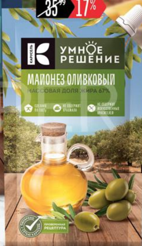
Майонез УМНОЕ РЕШЕНИЕ Оливковый 67%, 230 мл