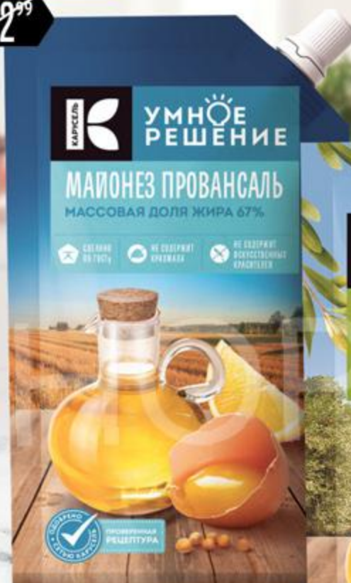
Майонез УМНОЕ РЕШЕНИЕ Провансаль 67%, 230 мл