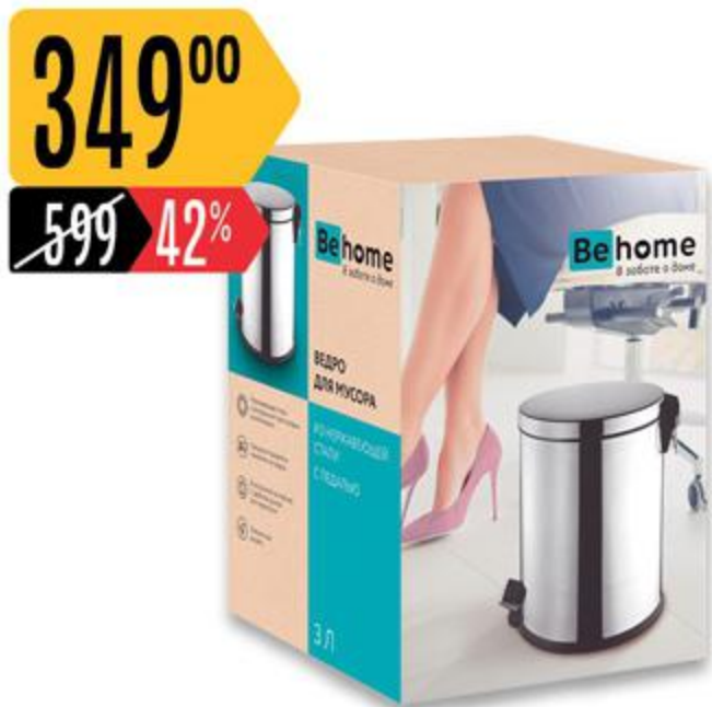
Ведро ВЕНОМЕ для мусора, с педалью, 3 л