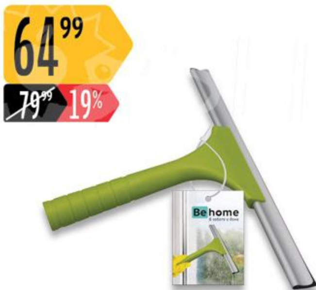
Водосгон ВЕНОМЕ Стеклоочиститель ВЕНОМЕ