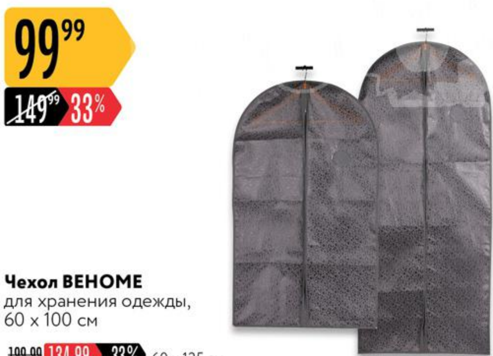
Чехол ВЕНОМЕ для хранения одежды, 60 x 100 см