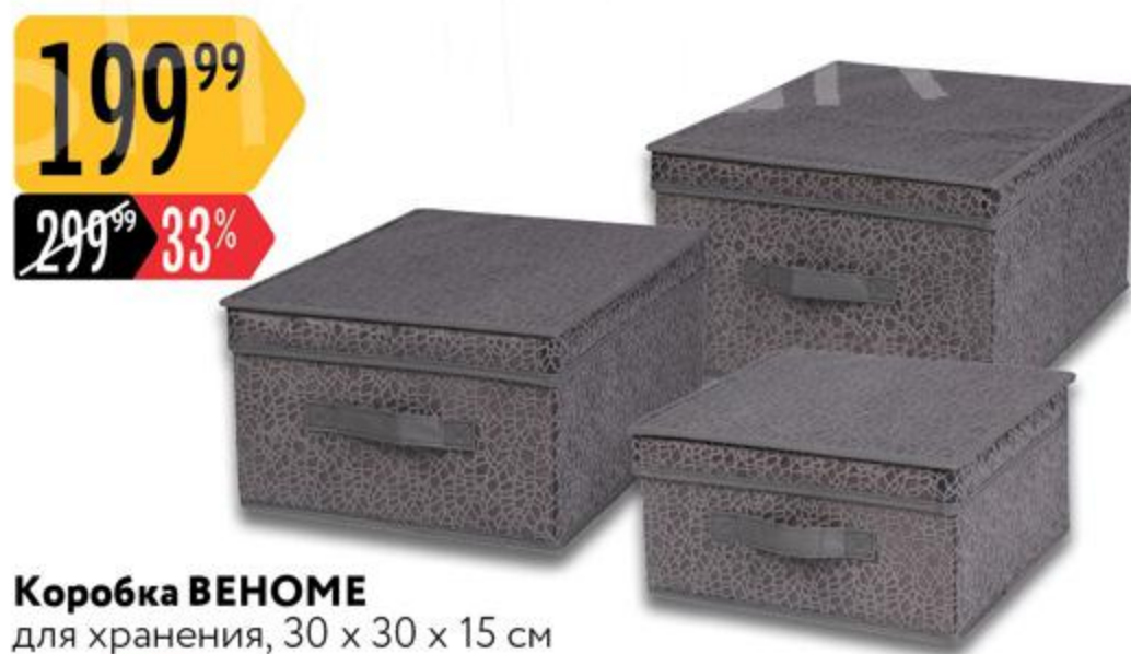
Коробка ВЕНОМЕ для хранения, 30 x 30 x 15 см