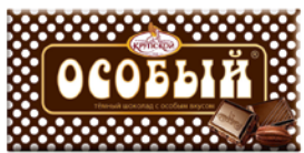
Шоколад ОСОБЫЙ (Крупской), 90 г