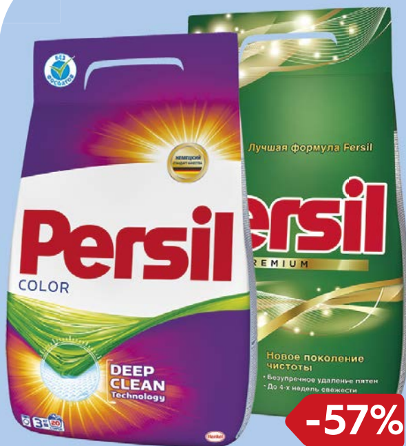
Порошок стиральный PERSIL® , В ассортименте***, 2,43 кг/ 3 кг