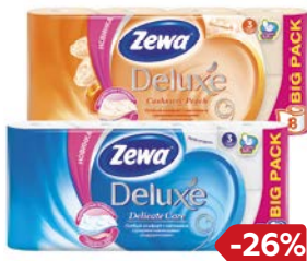
Бумага туалетная ZEWA® , Делюкс, 3-слойная: Белая/ С ароматом персика, 8 рулонов