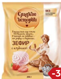
Зефир СЛАДКИЕ ИСТОРИИ , С кусочками клюквы/С клубни- кой, 250 г