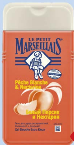
Гель для душа LE PETIT MARSEILLAIS® Белый персик и нектарин, 250 мл