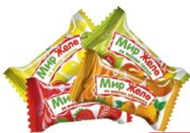
Конфеты МИР ЖЕЛЕ , Фруктовый микс, 100 г