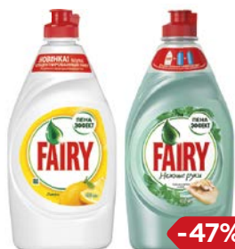
Средство для мытья посуды FAIRY® , В ассортименте***, 450 мл