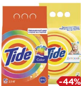
Порошок стиральный TIDE® , В ассортименте***, 2,5 кг/ 2,4 кг