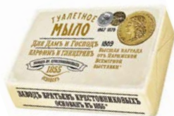
Мыло туалетное ДЛЯ ДАМЬ И ГОСПОДЬ , Парфюм и Глицерин, 190 г