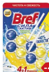
Блок туалетный BREF® , Сила Актив, Лимонная свежесть, 102 г