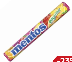
Драже МЕНТОС , Фрукты, 37 г