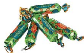
Батончики ОРЕХОВАЯ РОЩА (Красный Октябрь), 100г