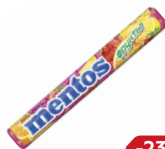
Драже МЕНТОС , Фрукты, 37г