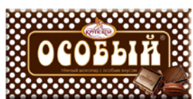
Шоколад ОСОБЫЙ (Крупской), 90г