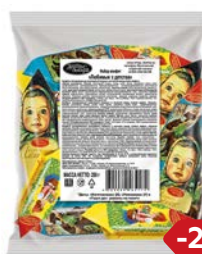
Конфеты ЛЮБИМЫЕ С ДЕТСТВА (Рот Фронт), 250г