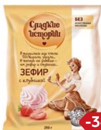
Зефир СЛАДКИЕ ИСТОРИИ , С кусочками клюквы/С клубни- кой, 250г