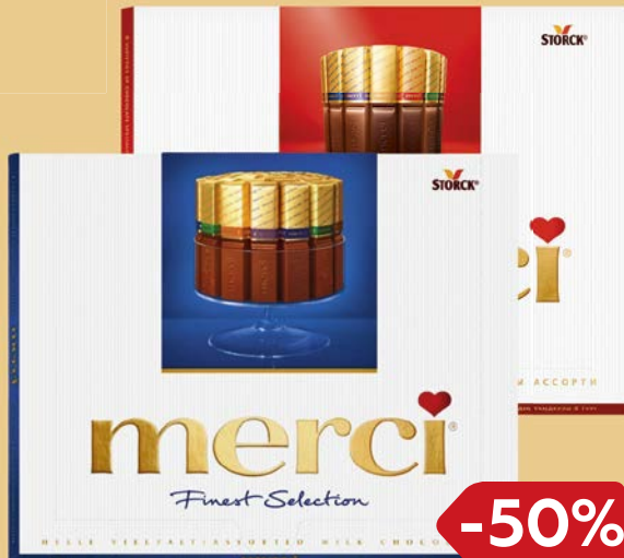
Конфеты шоколадные МЕРСИ , Ассорти/ Молочный шоколад, 250 г