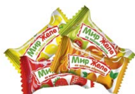
Конфеты МИР ЖЕЛЕ , Фруктовый микс, 100г