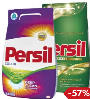
Порошок сти- ральный PERSIL® , В ассортименте***, 2,43 кг/ 3 кг