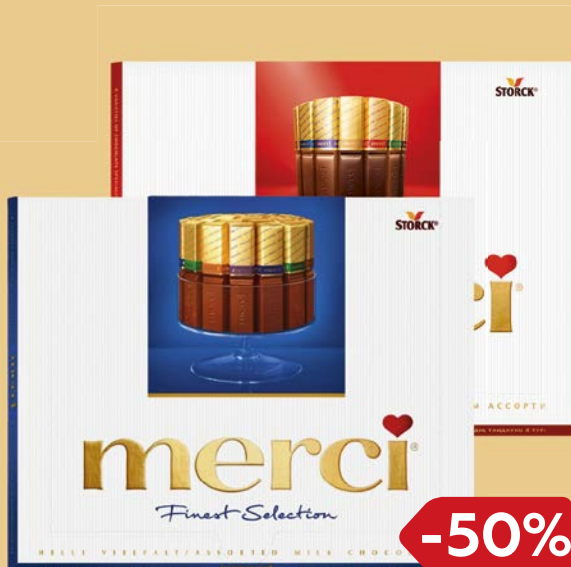
Конфеты шоколадные МЕРСИ , Ассорти/ Молочный шоколад, 250 г