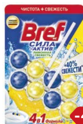
Блок туалетный BREF® , Сила Актив, Лимонная свежесть, 102 г