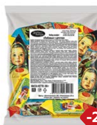
Конфеты ЛЮБИМЫЕ С ДЕТСТВА (Рот Фронт), 250г