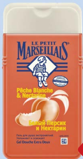
Гель для душа LE PETIT MARSEILLAIS® Белый персик и нектарин, 250 мл