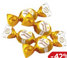
Конфеты ЗОЛОТАЯ ЛИЛИЯ (Контти-Рус), 100г