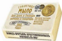
Мыло туалетное ДЛЯ ДАМЬ И ГОСПОДЬ , Пар- фюм и Глицерин, 190 г