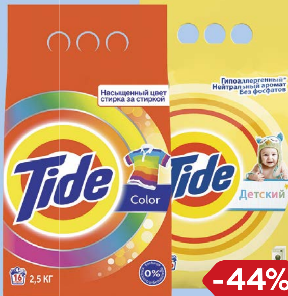
Порошок стиральный TIDE® , В ассортименте***: 2,5 кг/ 2,4 кг