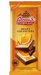
Шоколад РОССИЯ , Темный-белый: Цедра апельсина/ Тертый фундук, 85г