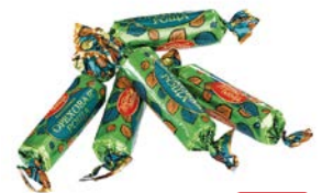
Батончики ОРЕХОВАЯ РОЩА (Красный Октябрь), 100г