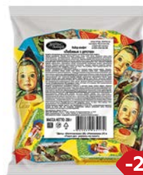
Конфеты ЛЮБИМЫЕ С ДЕТСТВА (Рот Фронт), 250г