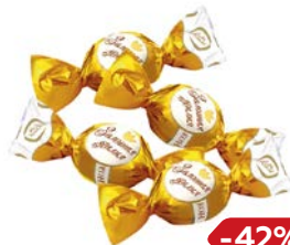
Конфеты ЗОЛОТАЯ ЛИЛИЯ (Континент-Рус), 100г