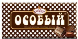
Шоколад ОСОБЫЙ (Крупской), 90г