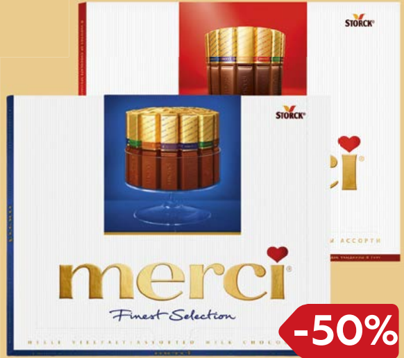
Конфеты шоколадные МЕРСИ , Ассорти/ Молочный шоколад, 250г