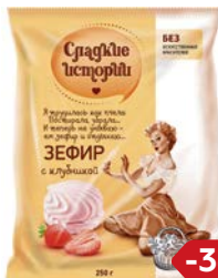
Зефир СЛАДКИЕ ИСТОРИИ , С кусочками клюквы/С клубни- кой, 250г