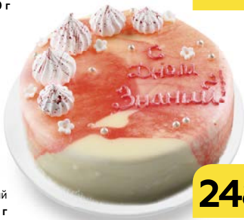
Торт бисквитный ЗЕРКАЛО , 800 г