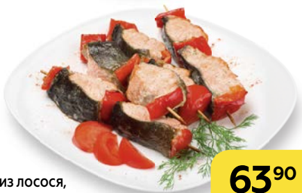
ШАШЛЫК ИЗ ЛОСОСЯ, гриль, 100 г