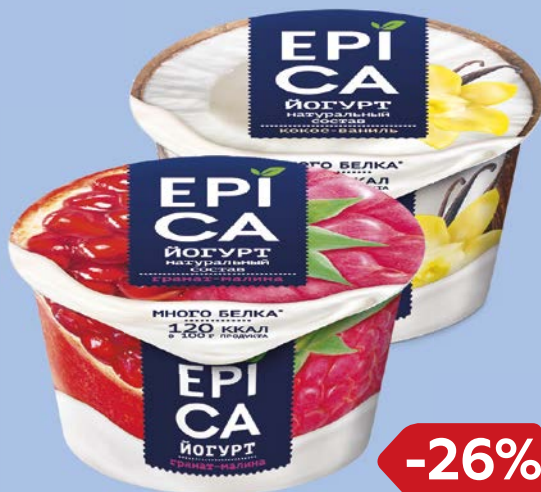
Йогурт ЭПИКА в ассортименте***, 130 г