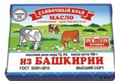
Масло сливочное ИЗ БАШКИРИИ , 72,5% (Клюкин В. В.), 180 г