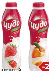
Йогурт питьевой ЧУДО , Персик-абрикос/ Клубника-земляника/ Вишня-черешня, 690 г