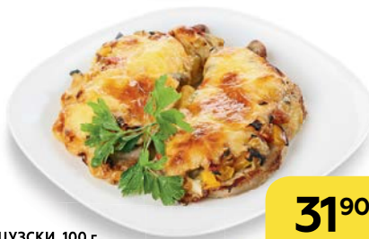
СВИНИНА ПО-ФРАНЦУЗСКИ, 100 г