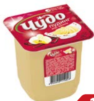
Пудинг ЧУДО , ваниль, 3%, 125 г