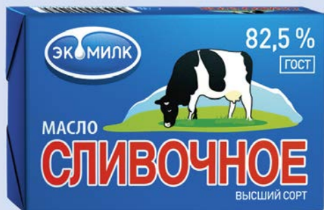
Масло сливочное ЭКОМИЛК , 82,5% (Озерецкий МК), 180 г