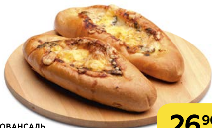
Батон ПРОВАНСАЛЬ с грибами, 150 г