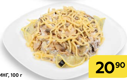
Салат ВИКИНГ , 100 г