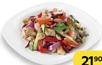
Салат МЮНХЕН , 100 г