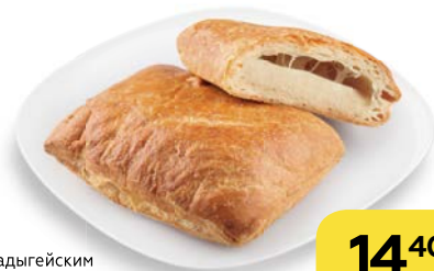
СЛОЙКА с адыгейским сыром и зеленью, 60 г