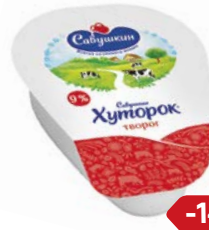
Творог САВУШКИН ХУТОРОК , 9%, 220 г