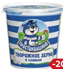
Творог ПРОСТОКВАШИНО , зерненный в сливках, 7%, 350 г