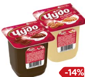
Пудинг ЧУДО , Шоколад/ Карамель, 125 г