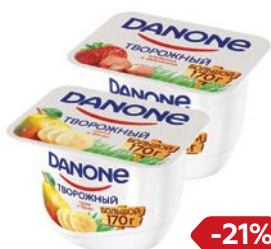
Продукт творожный DANONE , Клубника-земляника/ Персик-абрикос/ Груша-банан, 170 г