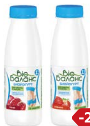
Бийогурт БИБАЛАНС питьевой, в ассортименте***, 330 г