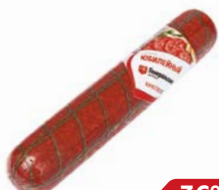
Сервелат ЮБИЛЕЙНЫЙ, Генеральские колбасы, варено- копченый (Агротэк), 400 г