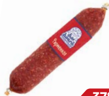
Колбаса ФИРМЕННАЯ сырокопченая (Дым Дымыч), 300 г