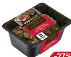
Свинина МИРАТОРГ Люкс на косточке, 650 г