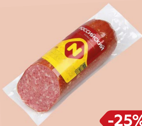
Сервелат РОССИЙСКИЙ Варено-копченый (ОМПК), 420 г