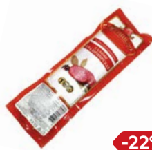
Салами ВЛАДИМИРСКАЯ, полукопченая (МПК Атяшевский), 350 г