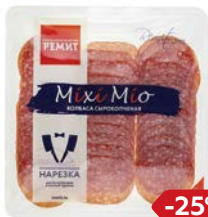
Колбаса АССОРТИ МИКС МИО сыро- копченая нарезка (Ремит), 100 г