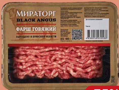
Фарш говяжий МИРАТОРГ, Охлажден- ный, 400 г