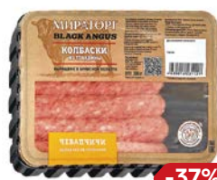
Колбаски ЧЕВАПЧИЧИ, Блэк Ангус из говядины (Мираторг), 300 г