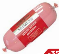
Колбаса ДОКТОРСКАЯ (Мираторг), 470 г