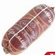
Колбаса ПРЕМИУМ, Вареная (МПК Атяшевский), 500 г