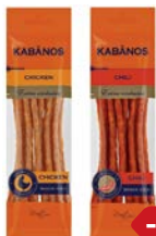
Колбаски КАБАНОС, Чикен/ Чили, 70 г